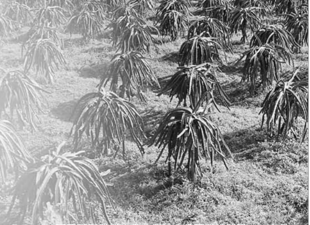
巴马天觉种养专业合作社火龙果种植基地(可广告)

批、购买出租商业铺面发展一批、利用闲置资产开发发展一批、以基础设施建设带动一批、通过能人创业带动一批”等“七个路径”的发展思路，强力推进村级集体经济发展。积极整合涉农资金6661万元，全县50个贫困村已全部有集体经济发展项目，50个村已有集体经济收入共216.805万元，其中收入最高的村达15万元。目前已成功吸引碧桂园、天津宝迪等龙头企业进驻巴马发展扶贫产业，创建生猪(香猪)、油茶、中草药等14个优势产业示范园区。