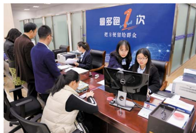
▲浙江省台州市行政服务中心的工作人员在给市民办理业务(3月28日摄)。经第三方评估，浙江“最多跑一次”实现率达87.9%，满意率达94.7%。