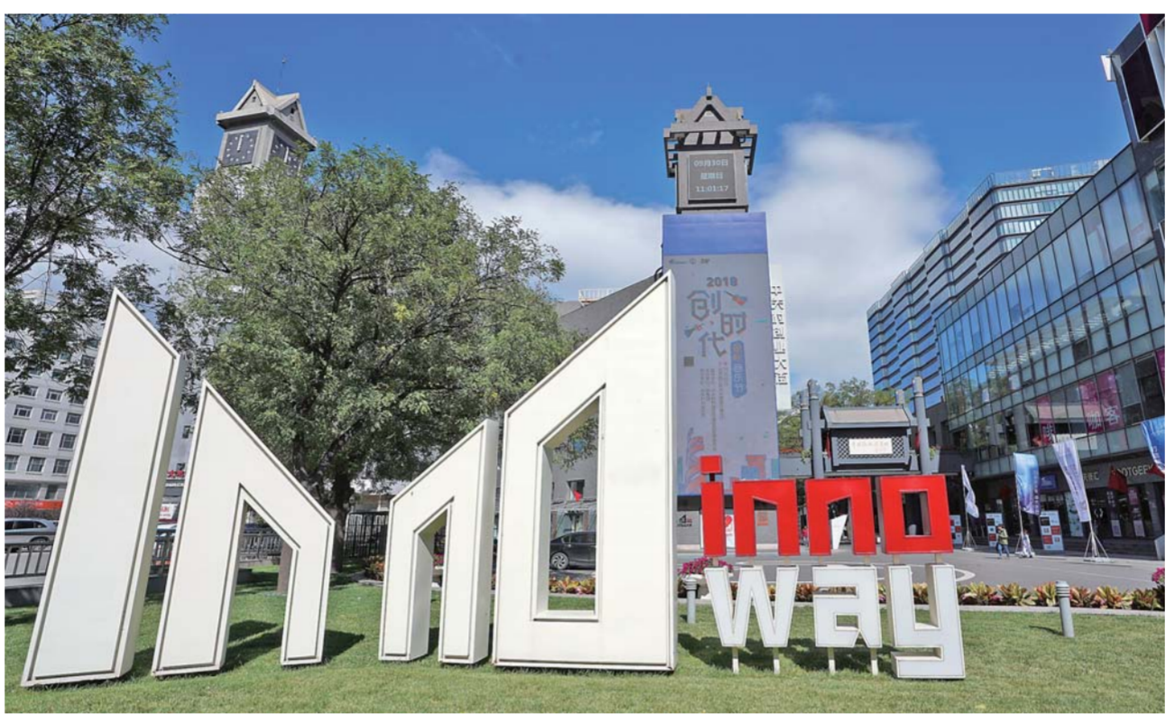
▲这是位于北京市海淀区的中关村创业大街(9月30日摄)。

筑巢引凤、聚才引智。位于海淀区中关村创业大街的“外籍人才服务窗口”，正是人才管理改革的具体举措，旨