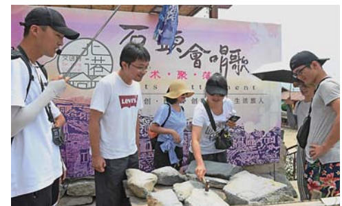
▲9月7日,游客在“石头会唱歌”艺术聚落体验敲打“会唱歌”的石头。