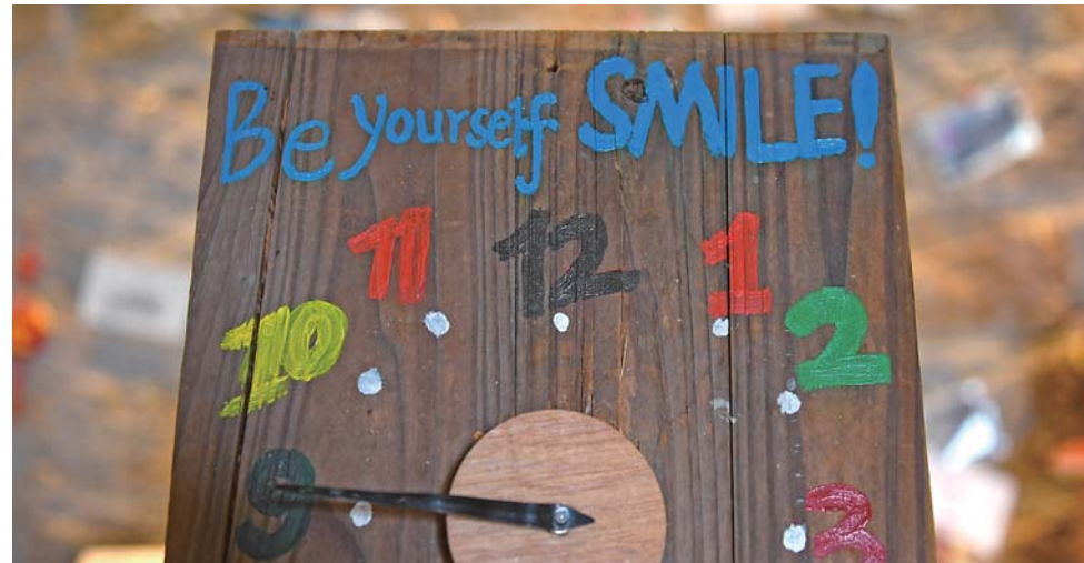
▲“石头会唱歌”艺术聚落里摆放的台湾创业青年制作的小工艺品——创意时钟(9月7日摄)。