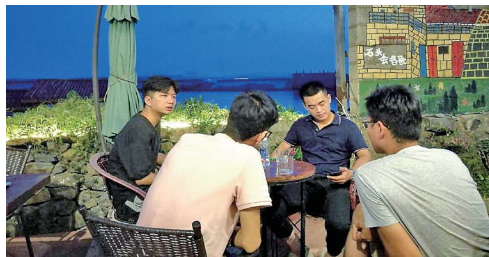
▲9月6日,平潭一家企业的代表(左一、左三)和“石头会唱歌”艺术聚落创业团队成员洽谈合作项目。