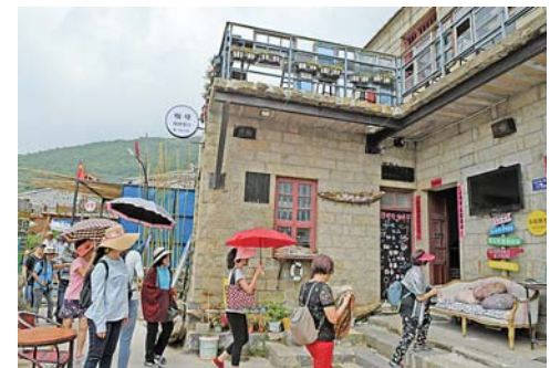
▲9月7日,游客在“石头会唱歌”艺术聚落参观。