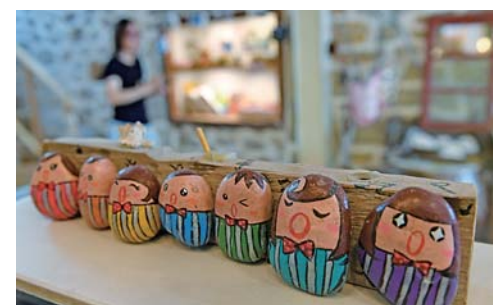
▲“石头会唱歌”艺术聚落摆放着台湾创业青年用北港村的石头制作的小工艺品(9月7日摄)。