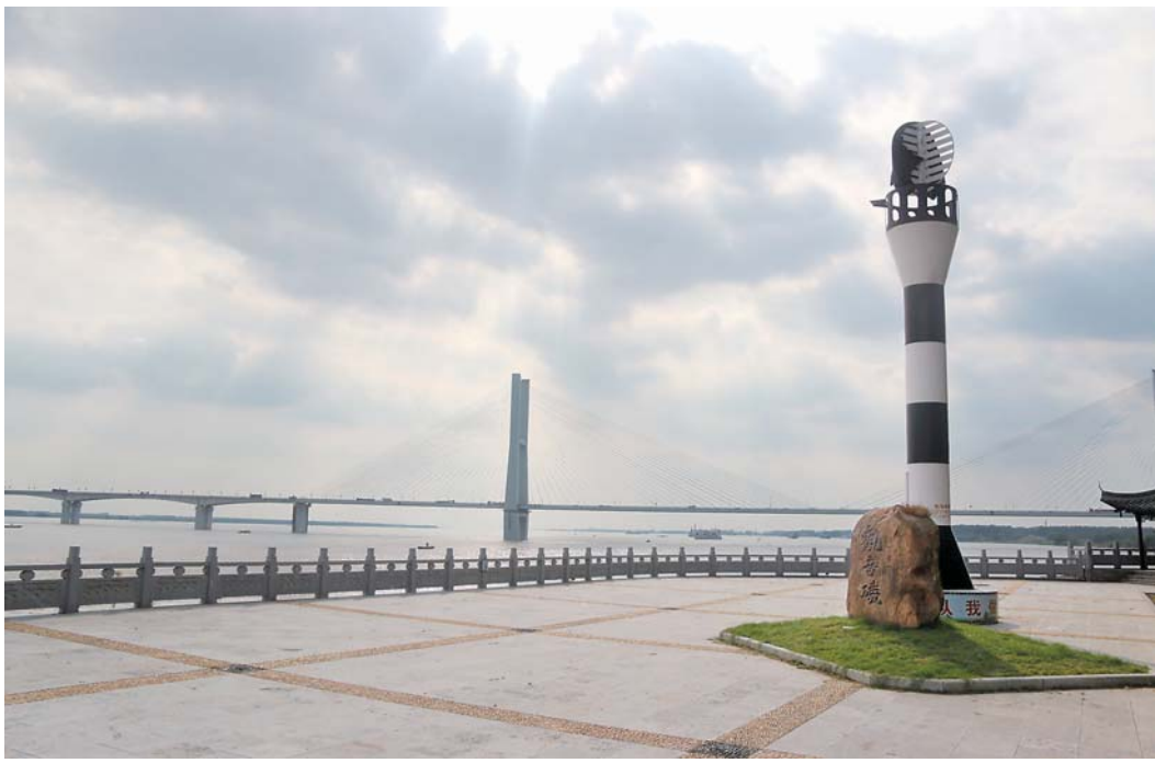
▲荆州长江大桥附近的观音矶。

“我听见青石板上的马蹄声碎了，我听见关帝庙前外婆的祈祷，我听说护城河边的桃花又开了”——作为“楚国故都、三国名城”的荆州，如今古老与现代并行