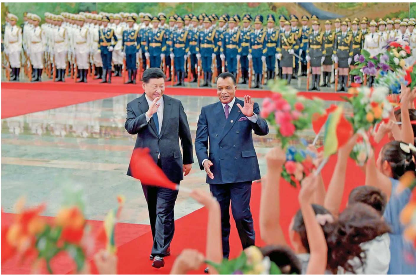
九月五日,国家主席习近平在北京人民大会堂同刚果共和国总统萨苏举行会谈。这是会谈前,习近平在人民大会堂北大厅为萨苏举行欢迎仪式。