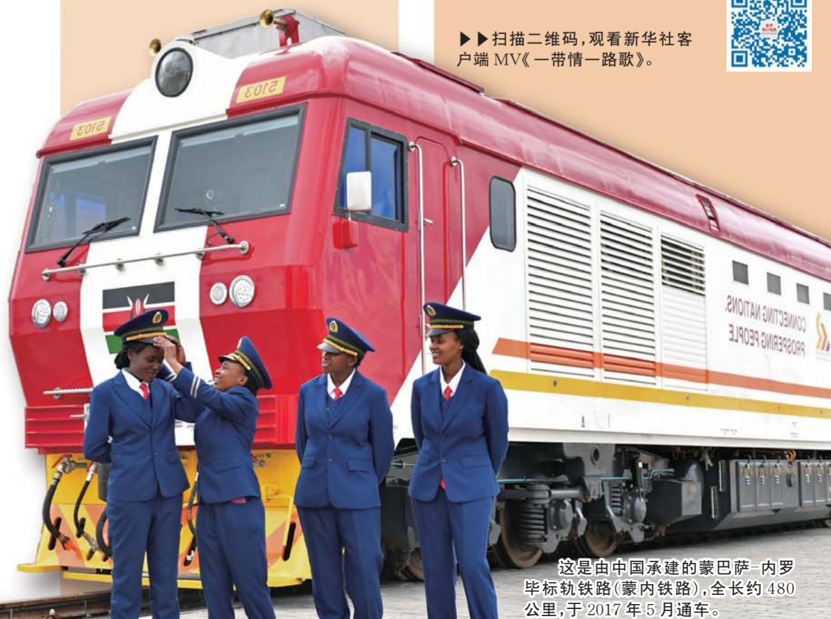
这是由中国承建的蒙巴萨-内罗毕标轨铁路(蒙内铁路)，全长约480公里，于2017年5月通车。