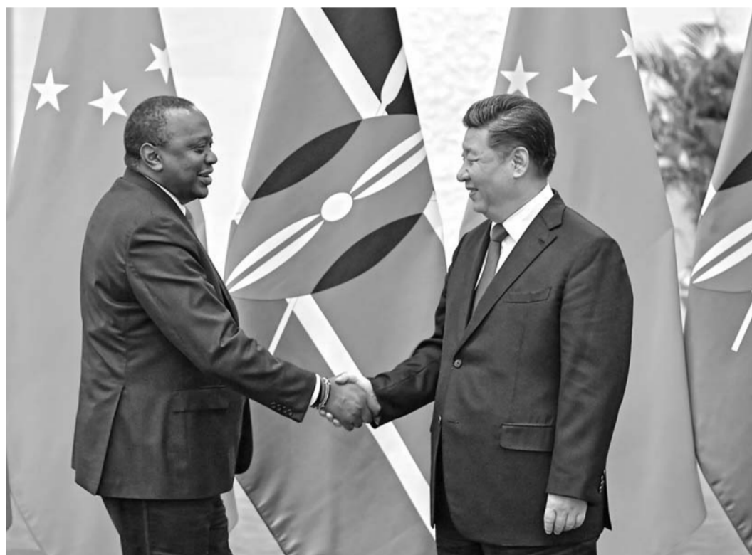
▲9月4日,国家主席习近平在北京人民大会堂会见肯尼亚总统肯雅塔。