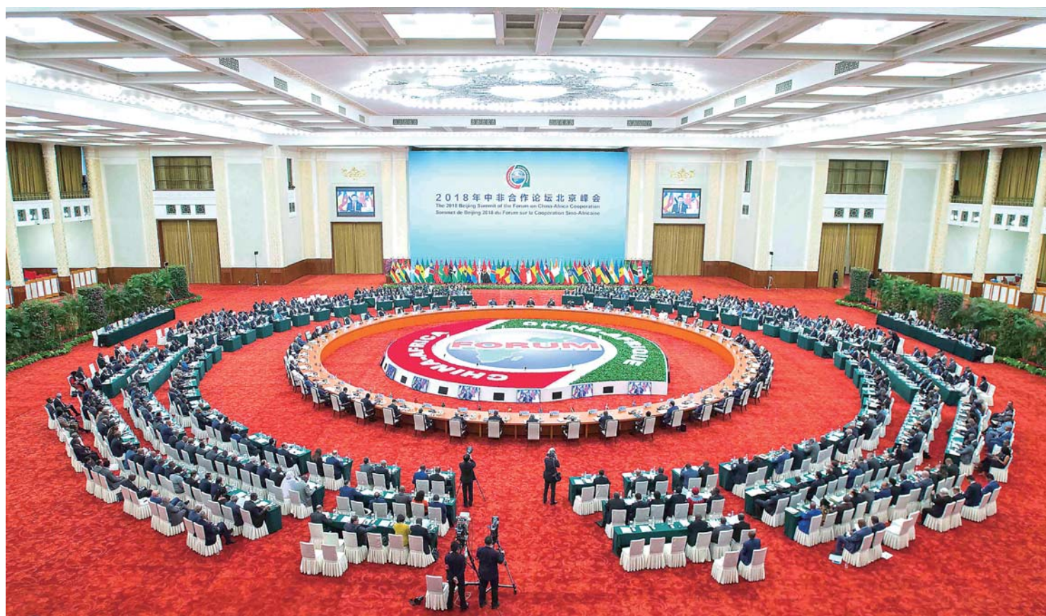
▲ 9 月 4 日，中非合作论坛北京峰会圆桌会议在北京人民大会堂举行。国家主席习近平主持第一阶段会议。