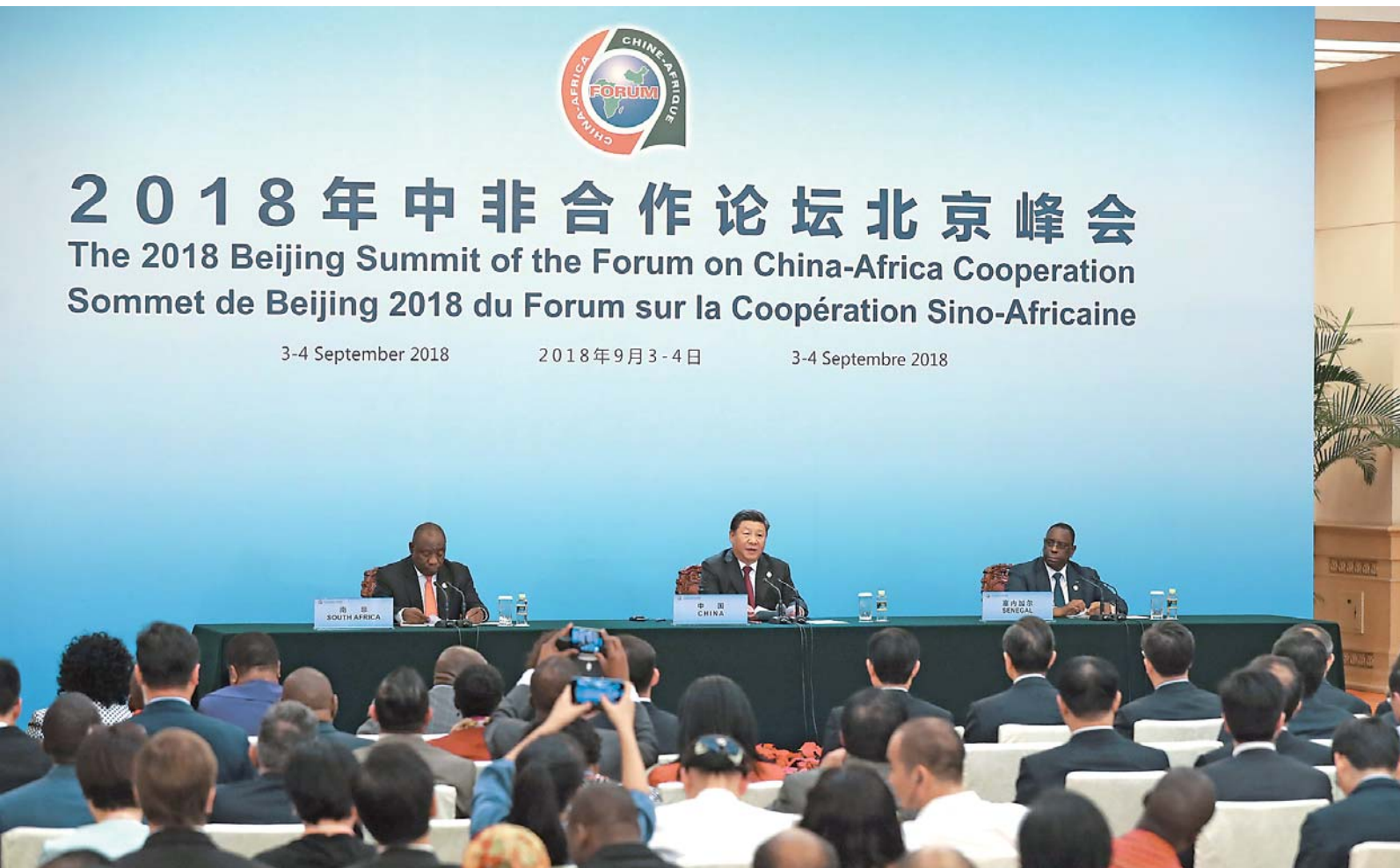
九月四日，二〇一八年中非合作论坛北京峰会闭幕后，国家主席习近平同论坛前任共同主席国南非总统拉马福萨、新任共同主席国塞内加尔总统萨勒在人民大会堂共同会见记者。

新华社北京 9 月 4 日电(记者郑明达、孙奕)4 日，2018 年中非合作论坛北京峰会闭幕后，国家主席习近平同论坛前任共同主席国南非总统拉马福萨、新任共同主席国塞内加尔总统萨勒在人民大会堂共同会见记者。