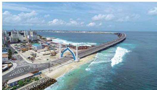
中马友谊大桥正式开通

中马友谊大桥8月30日晚正式开通。中马友谊大桥是中国和马尔代夫两国在共建21世纪海上丝绸之路领域的标志性项目。