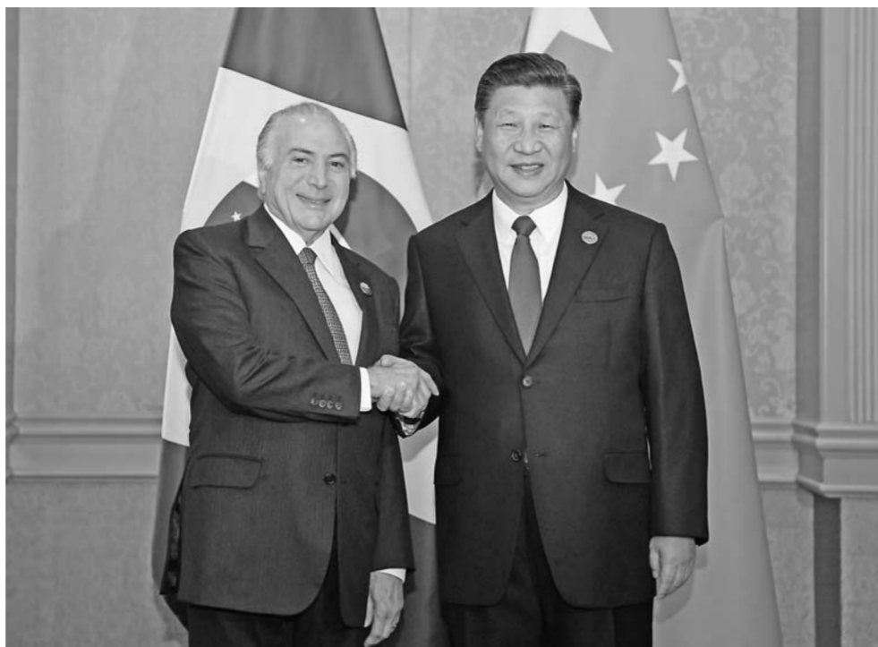
▲7月26日，国家主席习近平在南非约翰内斯堡会见巴西总统特梅尔。