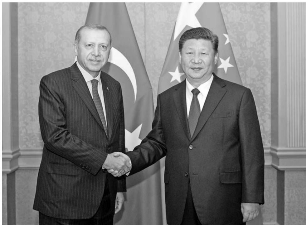
▲7月26日，国家主席习近平在南非约翰内斯堡会见土耳其总统埃尔多安。