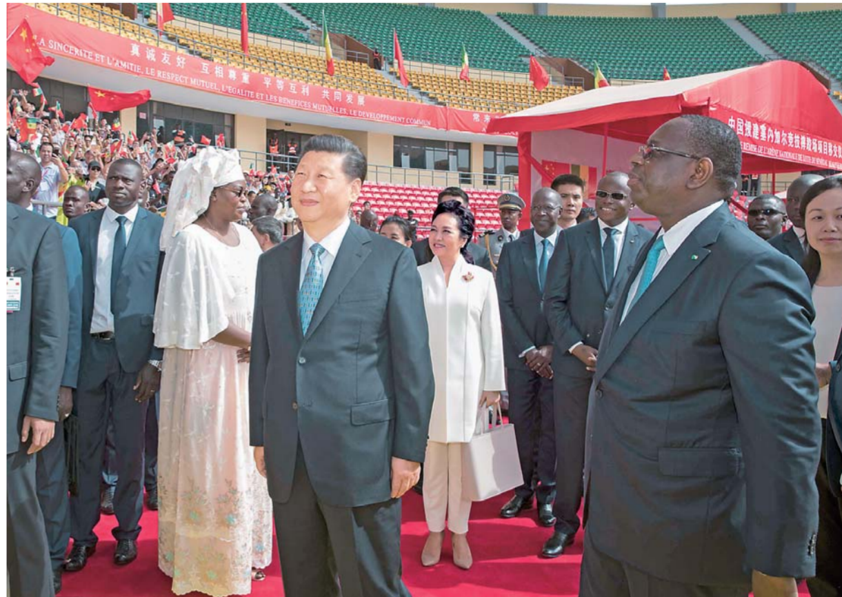
▲7月22日,国家主席习近平在达喀尔同塞内加尔总统萨勒共同出席塞内加尔摔跤项目移交仪式。