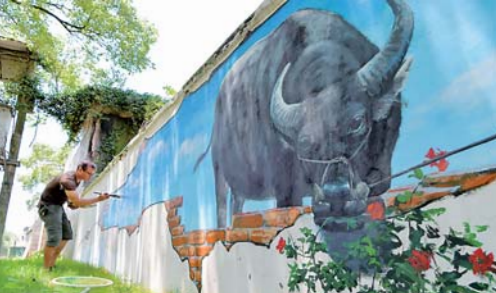
江西共青城乡村“如画”

江西共青城市大力推进秀美乡村建设，邀请当地有名的乡土画家入村创作具有乡土特色及农耕文化气息的壁画。