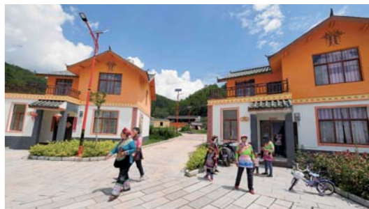
傣族山村的美丽蝶变

云南省楚雄彝族自治州武定县发窝乡养马场村是一个傣族村寨。在当地政府和爱心企业帮扶下，村民搬入宽敞漂亮的新居。