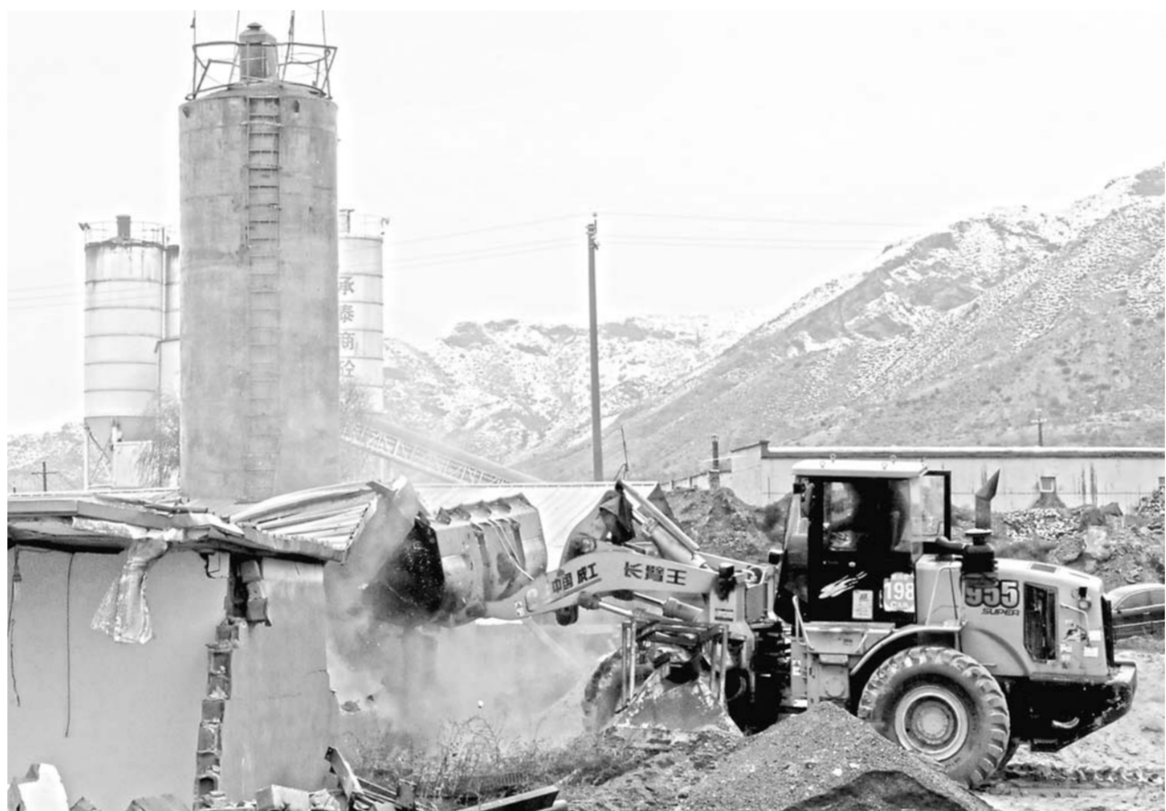
▲位于大青山国家级自然保护区南侧边缘的一家违法建材企业的库房被依法拆除(2015年11月6日摄)。

就在执法检查组奔赴地方前召开的会议上，每位检查组成员都拿到了这样一份《执法检查参考问题》：