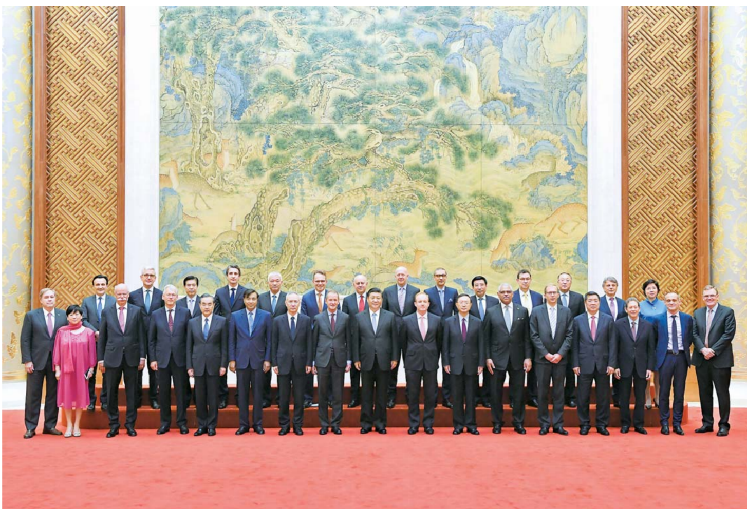
▲6月21日,国家主席习近平在北京钓鱼台国宾馆会见来华出席“全球首席执行官委员会”特别圆桌峰会的知名跨国企业负责人,并同他们座谈交流。