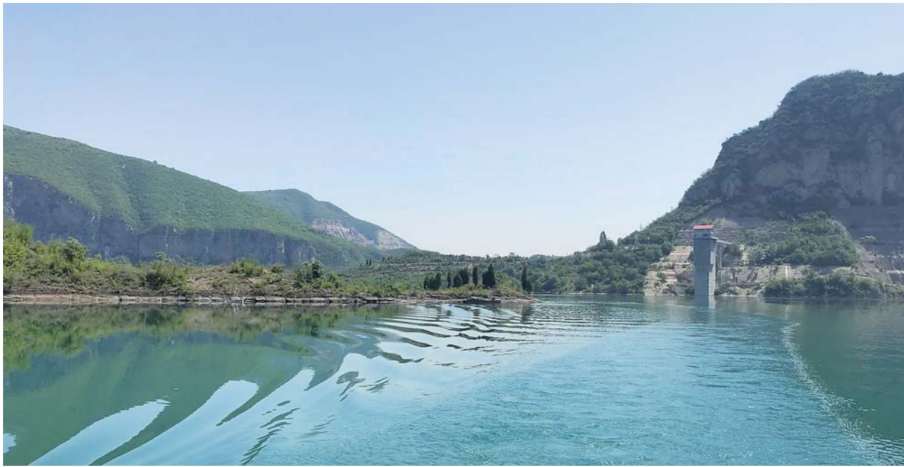
▲这是以防洪和供水为主的大型水利枢纽工程盘石头水库(6月12日摄)。

大职责：清洁、宣传、信息报告。他说：“我做专职护河员6年了，清洁的压力越来越小了，感觉淇河特别美、特别亲近。”