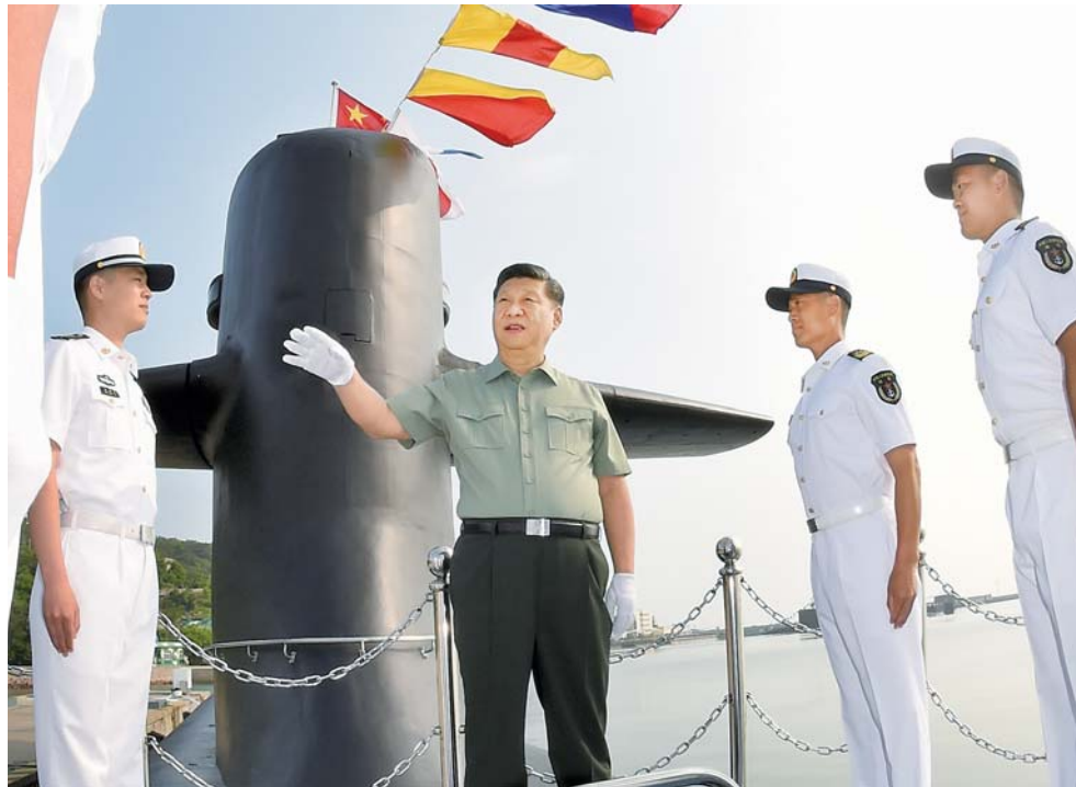
▲6月11日下午,中共中央总书记、国家主席、中央军委主席习近平视察北部战区海军。这是习近平来到某潜艇部队,登上潜艇,同艇员亲切交谈。

新华社济南6月15日电(记者李宜良、吴登峰)中共中央总书记、国家主席、中央军委主席习近平11日下午视察北部战区海军,强调要坚决贯彻新时代党的强军思想,坚持政治建军、改革强军、科技兴军、依法治军,贯彻转型建设要求,锻造海上精兵劲旅,坚决完成党和人民赋予的各项任务。