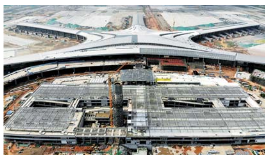
青岛胶东国际机场建设忙

目前,青岛胶东国际机场航站楼屋顶封闭及幕墙安装工作进入最后阶段。大面积装饰装修工程即将全面启动。