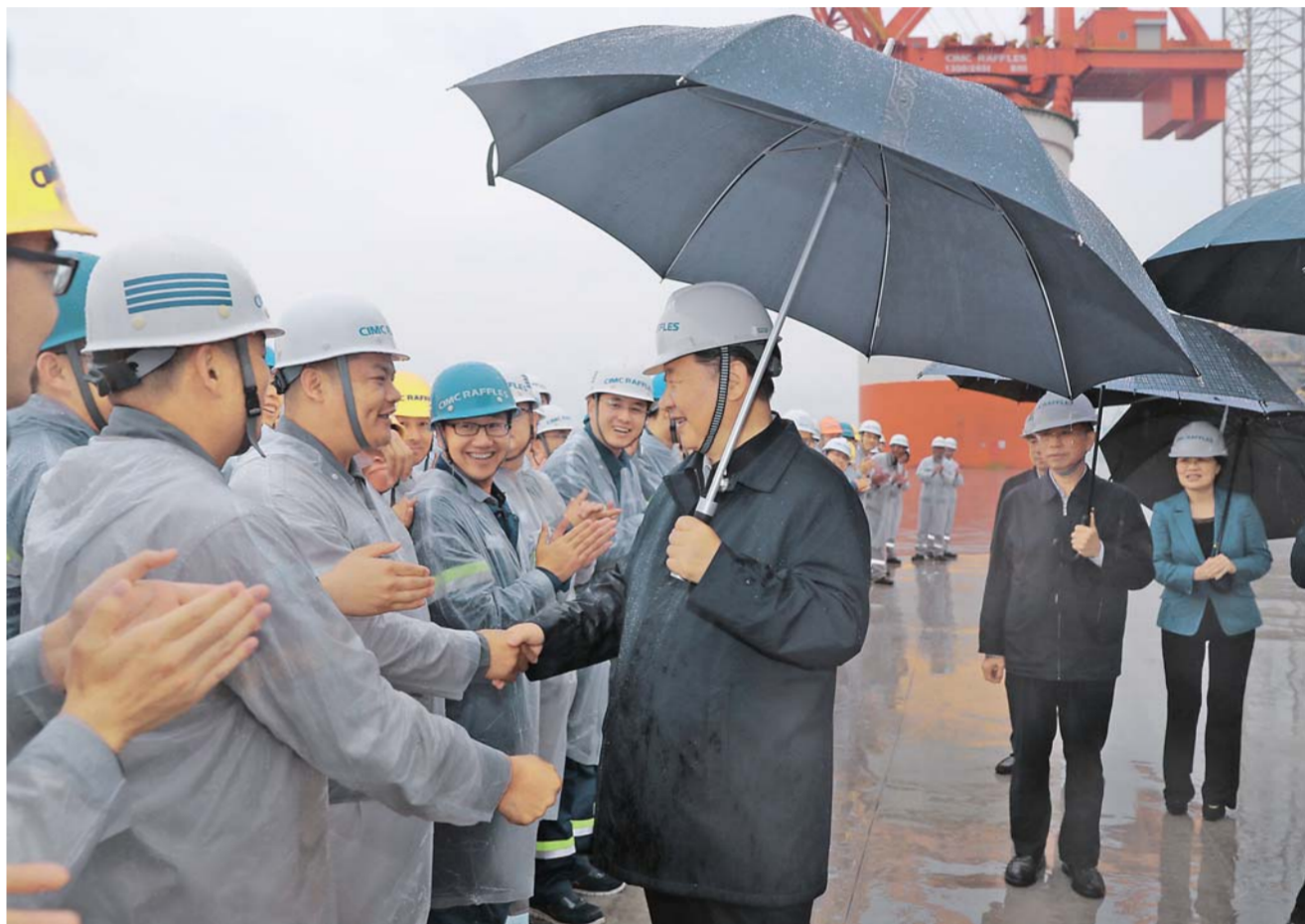
▲6月12日至14日,中共中央总书记、国家主席、中央军委主席习近平在山东考察。这是13日下午,习近平在中集来福士海洋工程有限公司烟台基地,冒雨察看海洋工程设备建设场地,并同现场的工人们亲切握手。

新华社济南6月14日电中共中央总书记、国家主席、中央军委主席习近平近日在山东考察时强调,切实把新发展理念落到实处,不断取得高质量发展新成就,不断增强经济社会发展创新力,更好满足人民日益增长的美好生活需要。