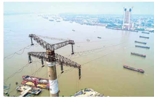
6月14日,江苏对镇江220千伏五峰山跨江线路启动升高改造工程,进行旧线拆除等施工,工程预计于今年11月全部完工。