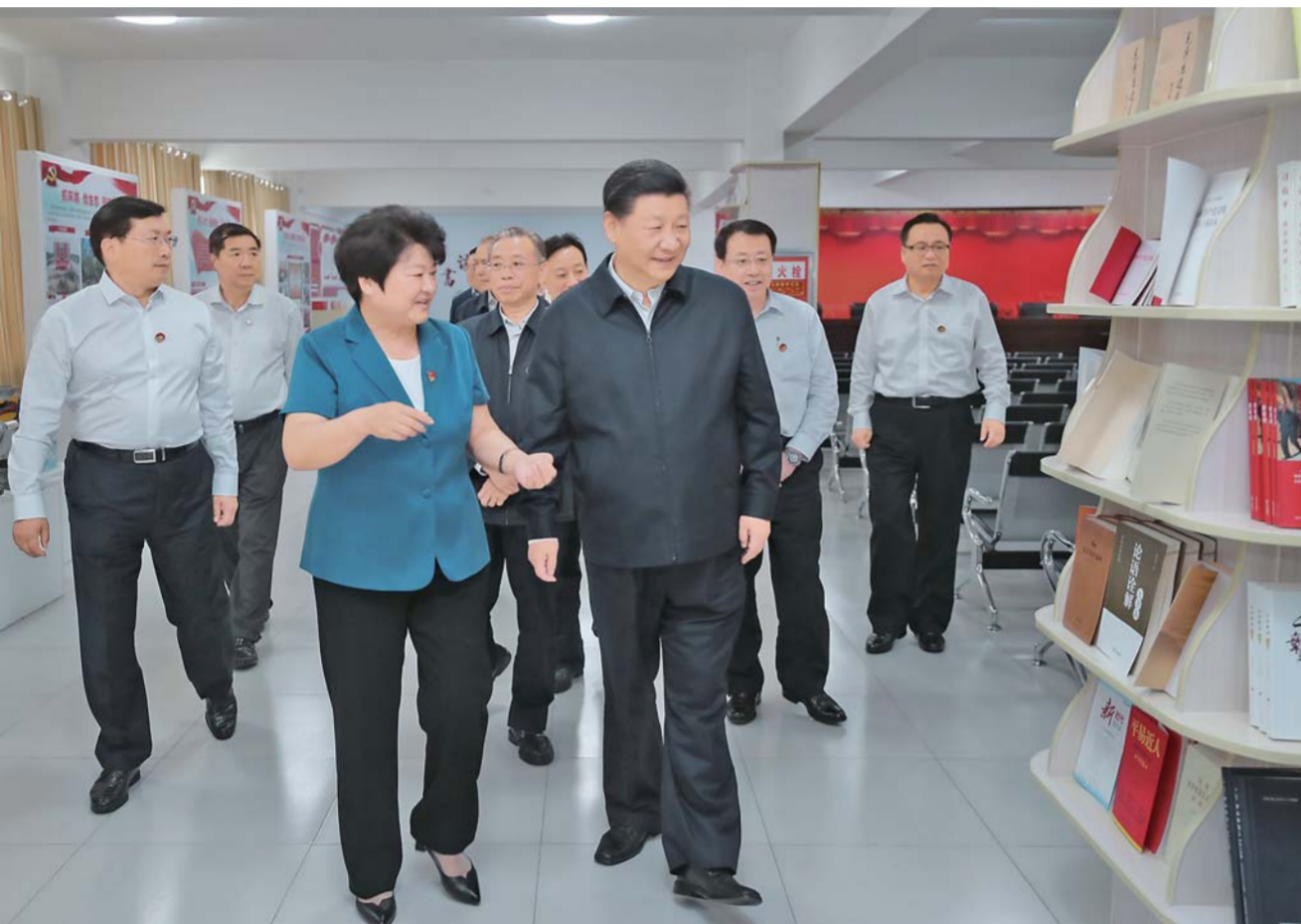
▲6月12日至14日,中共中央总书记、国家主席、中央军委主席习近平在山东考察。这是14日上午,习近平在济南市章丘区双山街道三涧溪村,了解该村以党建为统领,推动乡村振兴情况。