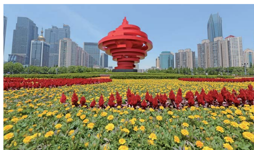
▲青岛盛装迎贵宾，6月3日拍摄的青岛五四广场。