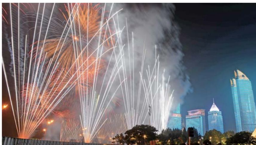
▲这是9日晚在青岛举行的《有朋自远方来》灯光焰火艺术表演。