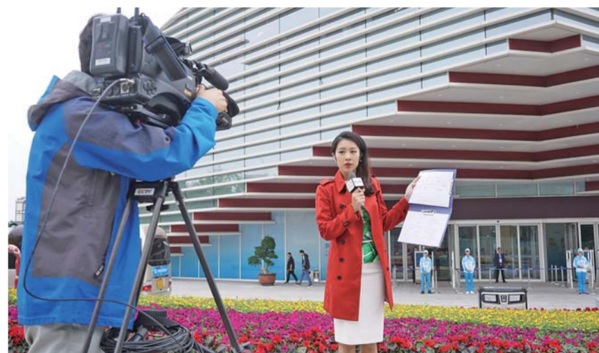
▲6月9日，记者在上合青岛峰会新闻中心为录制做准备。