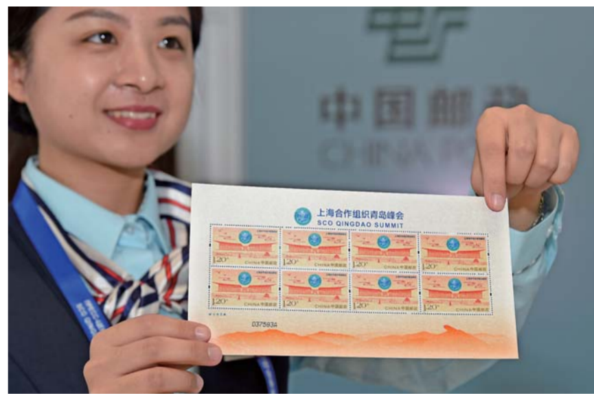
▲6月9日，在上海合作组织青岛峰会新闻中心邮政服务点，一名邮政工作人员展示纪念邮票。