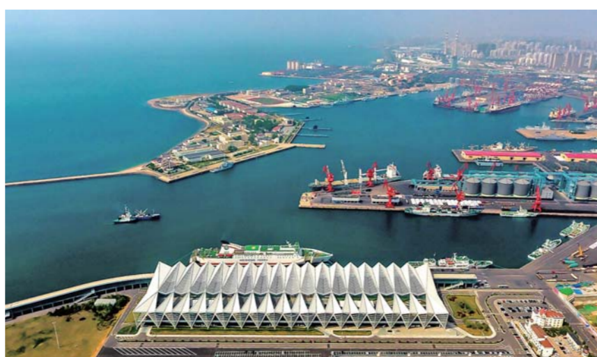
▲青岛盛装迎贵宾，这是青岛邮轮母港（5月7日）无人机拍摄。