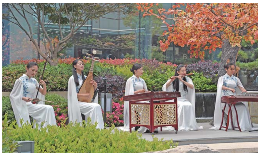
▲在上合青岛峰会新闻中心一楼的露天中庭花园，几名乐手在进行民乐合奏（6月6日摄）。