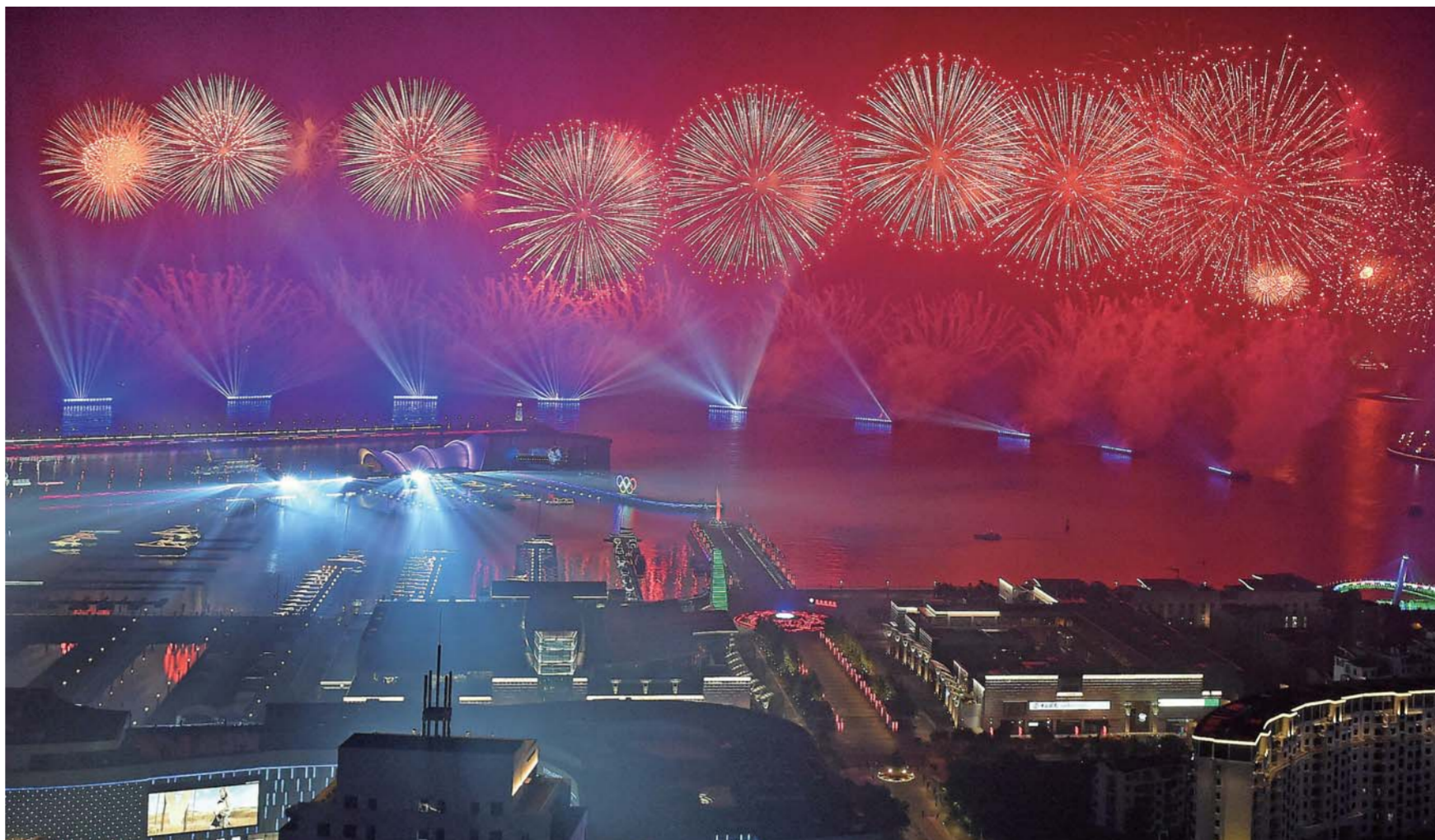
▲6月9日至10日，上海合作组织青岛峰会在山东青岛召开。这是9日晚在青岛举行的《有朋自远方来》灯光焰火艺术表演。