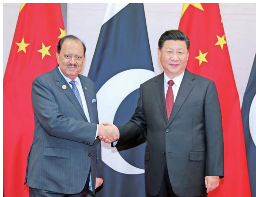
▶6月9日,国家主席习近平在青岛会见巴基斯坦总统侯赛因。