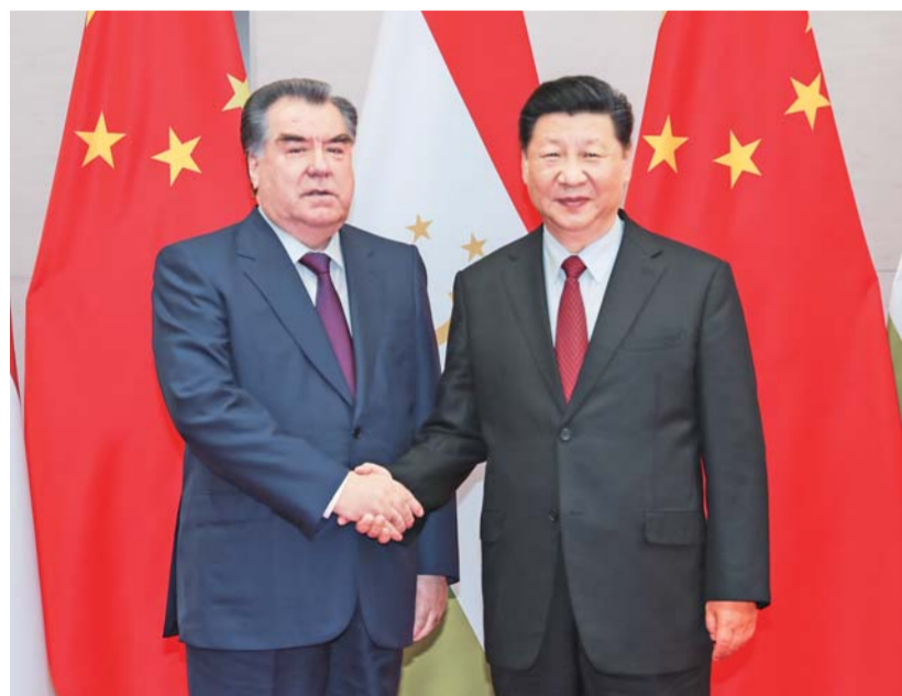
▶6月9日,国家主席习近平在青岛会见塔吉克斯坦总统拉赫蒙。