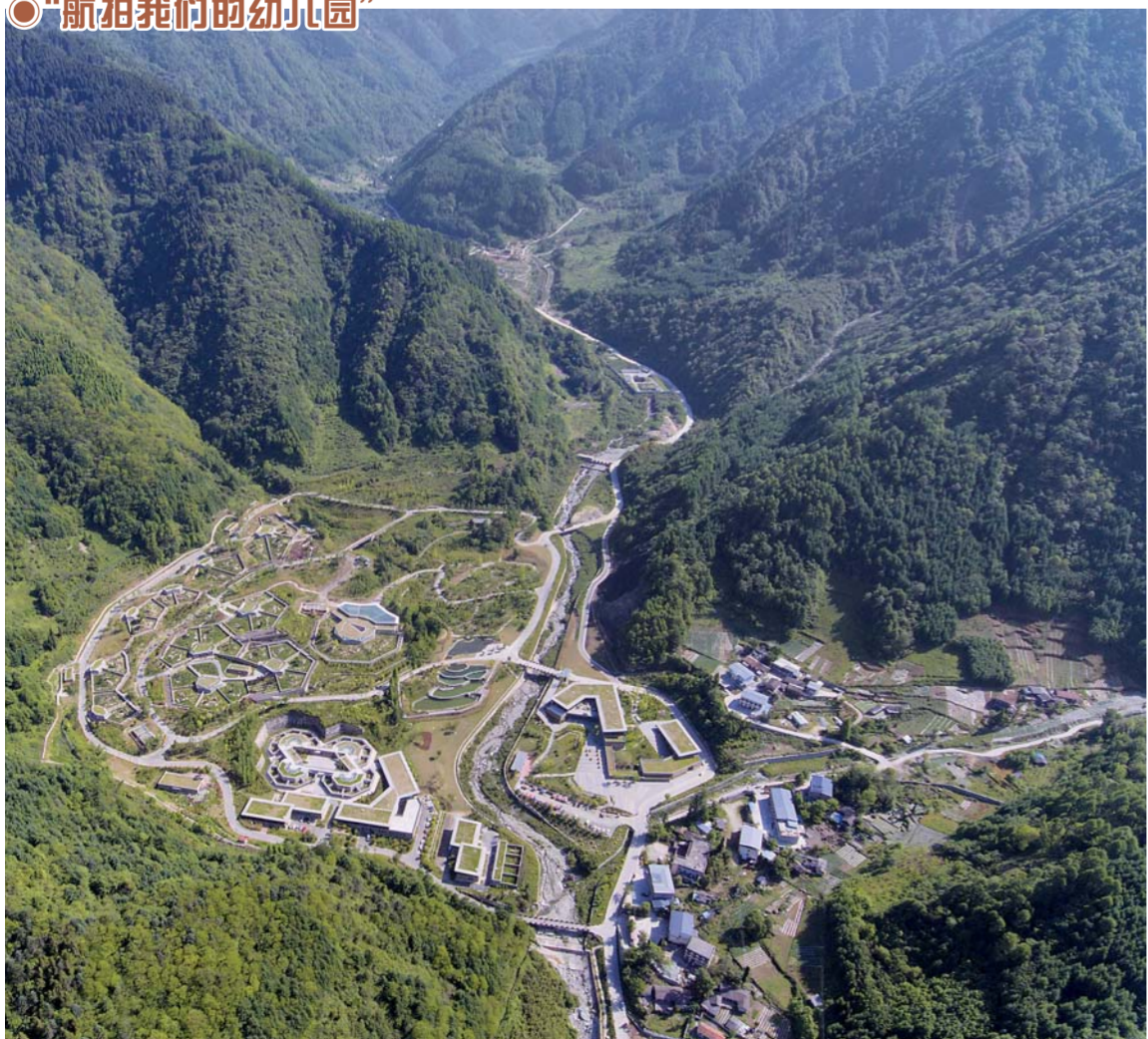
▲5月16日无人机拍摄的中国大熊猫保护研究中心神树坪基地。