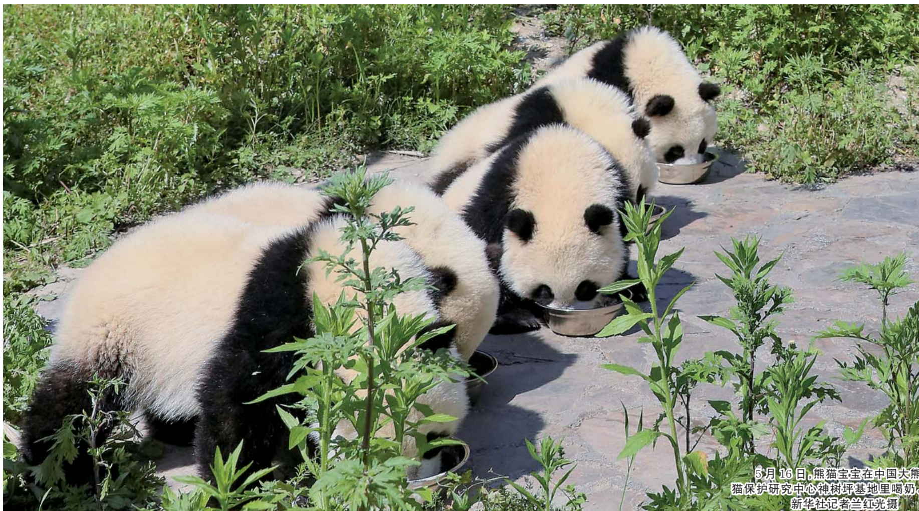
5月16日,熊猫宝宝在中国大熊猫保护研究中心神树坪基地里喝奶。