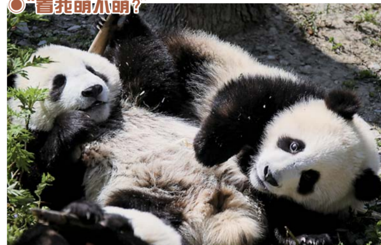
▲5月16日,几只熊猫宝宝在中国大熊猫保护研究中心神树坪基地里享受阳光和美食。