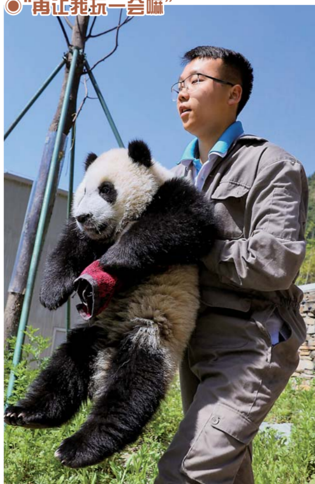
▲5月16日,在中国大熊猫保护研究中心神树坪基地,一位饲养员抱着熊猫宝宝。