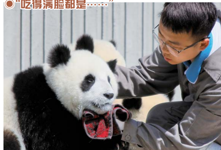
▲5月16日,在中国大熊猫保护研究中心神树坪基地,一位饲养员在照料熊猫宝宝。