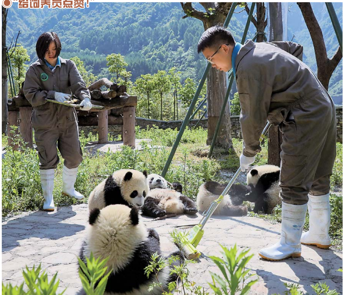
▲5月16日,在中国大熊猫保护研究中心神树坪基地,两位饲养员在照料熊猫宝宝。

初夏,中国大熊猫保护研究中心神树坪基地被苍翠的群山环抱,2017年新生的19只熊猫宝宝在这里健康快乐地成长着。神树坪基地位于四川卧龙国家级自然保护区的耿达乡,是集大熊猫饲养、繁育、研究以及公众教育和高端科学观察为一体的大熊猫保护研究基地。2008年,汶川地震曾让中国大熊猫保护研究中心卧龙基地遭受重创,基地的大熊猫被分散安置在全国多个野生动物园和城市动物园里。但卧龙仍是最适合大熊猫栖息的地方。2016年5月11日,在香港特区政府的支持下,总投资逾2亿元人民币、占地约150公顷的神树坪基地开园。目前,该基地共有大熊猫50余只。据悉,基地今年还将陆续迎来新的熊猫宝宝诞生。