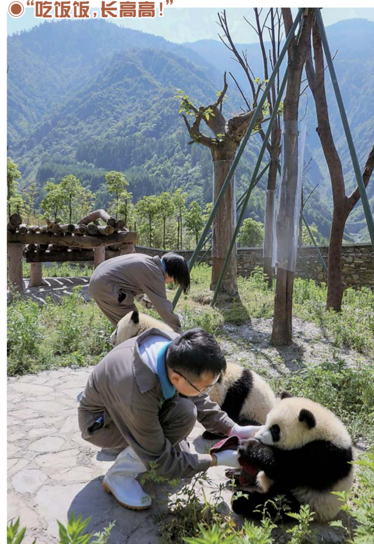
▲5月16日,在中国大熊猫保护研究中心神树坪基地,两位饲养员在照料熊猫宝宝。