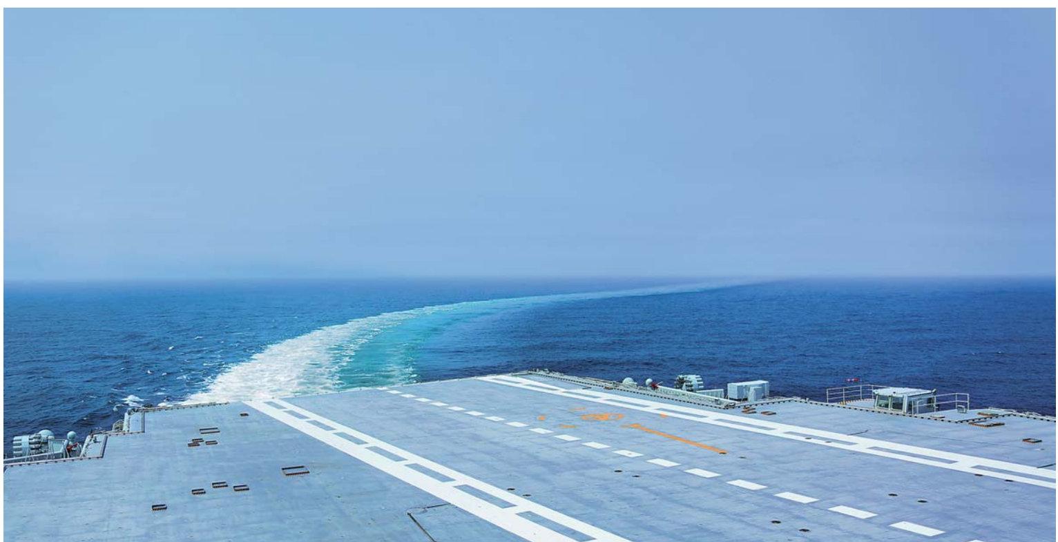
▲5月18日中午，我国第二艘航母完成首次海上试验任务，返抵大连造船厂码头。