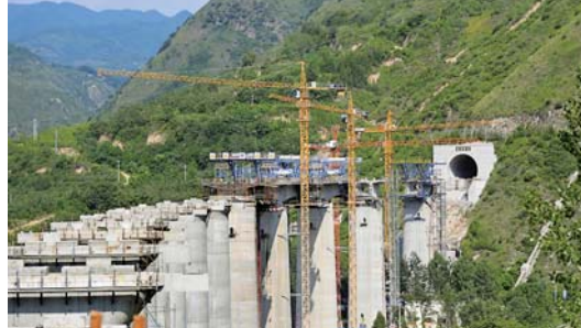
蒙华铁路加紧施工

蒙华铁路正在加紧施工。蒙华铁路北起内蒙古鄂尔多斯，南至江西吉安，是目前世界上一次性投资建成里程最长的重载铁路。