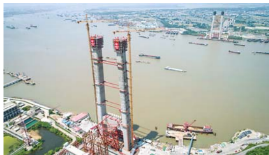
五峰山长江大桥南主塔成功封顶

5月15日，五峰山长江大桥南主塔成功封顶。五峰山长江大桥是我国首座公铁两用悬索桥，预计2020年竣工通车。