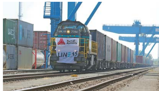
“唐山—安特卫普”中欧班列抵比利时 5月12日，由中国唐山港发出的首发“唐山—安特卫普”中欧班列直达列车驶抵比利时安特卫普港铁路货运露天堆场。