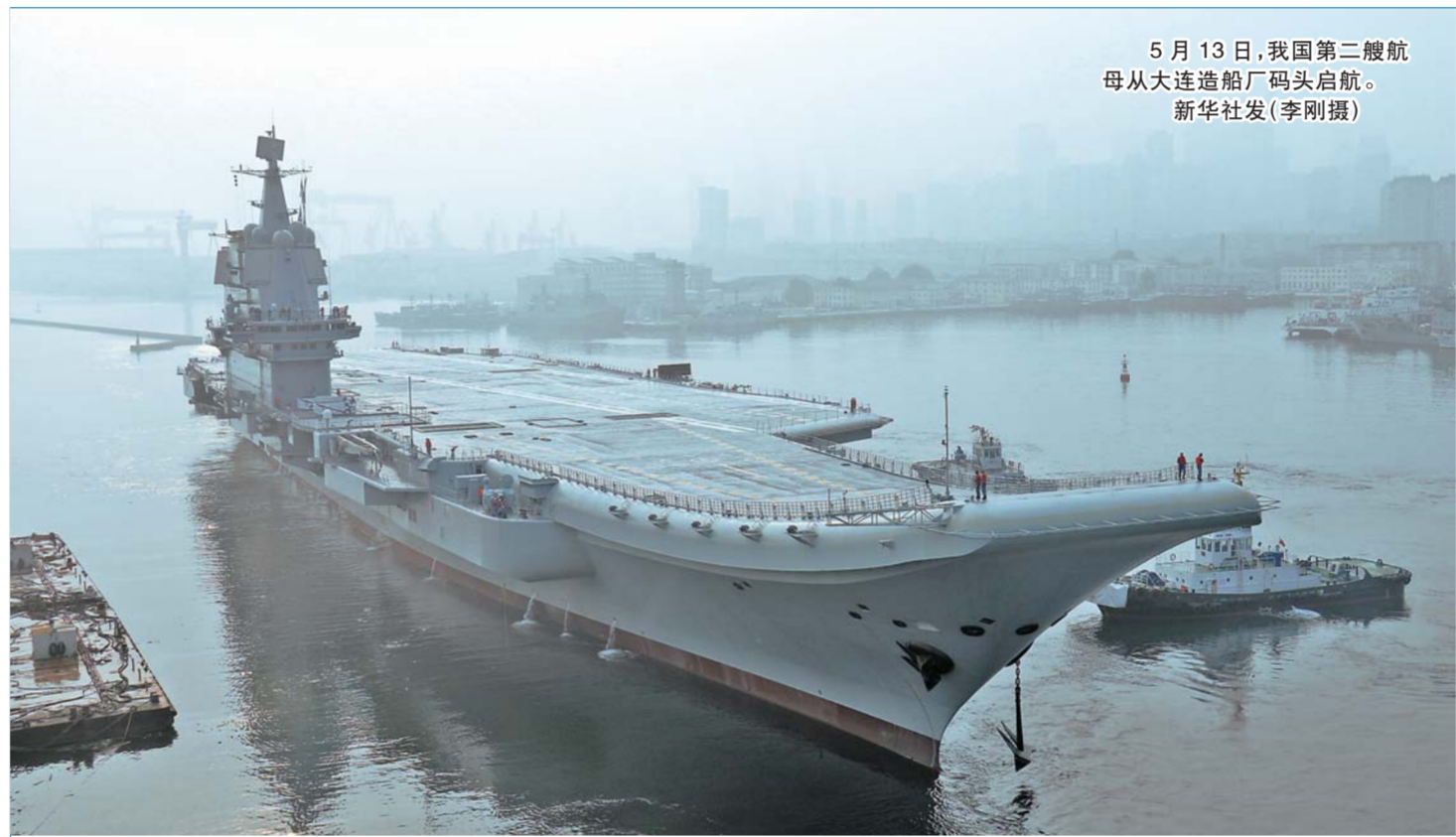
5月13日，我国第二艘航母从大连造船厂码头启航。

“一带一路”倡议或将成为人类历史上规模最大、最为重要的经济发展项目，它将以前所未有的方式推动商业并为人类福祉作出贡献。”英国亚洲之家主席葛霖如此展望。（下转3版）