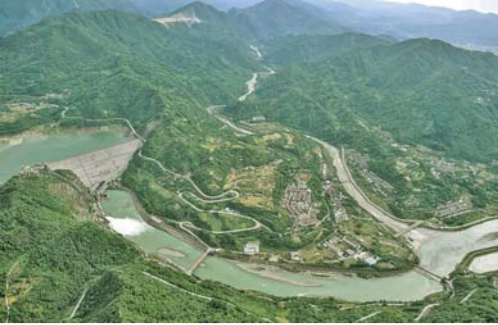
5月12日拍摄的四川都江堰市境内风貌。汶川地震十周年之际，昔日满目疮痍的地震灾区如今面貌一新。