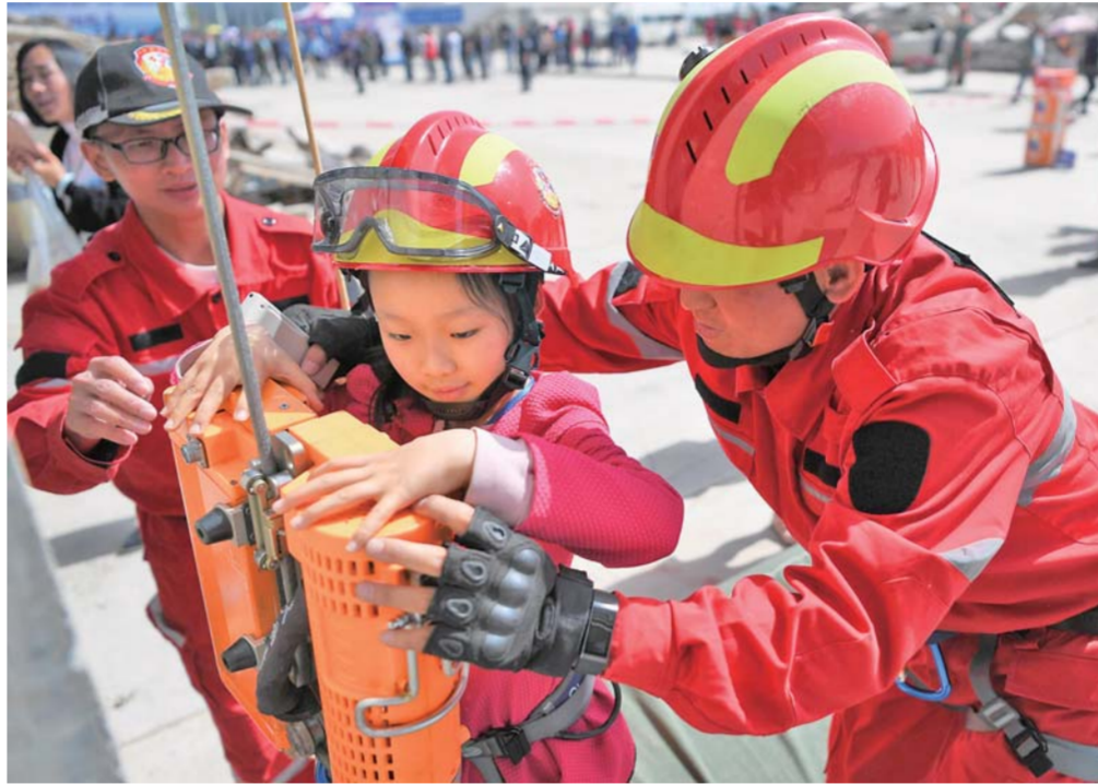
▲5月12日，小朋友在兰州国家陆地搜寻与救护基地体验应急逃生装备。当日是全国防灾减灾日，兰州国家陆地搜寻与救护基地举行公众开放日活动。

中国工程院院士、中国医师协会肾脏内科医师分会会长陈香美建议，按照现场救治、前方患者甄别、后方危重病人抢救需要建立多学科联合、知识结构合理、团队优势明显的专业紧急救援队伍。清华长庚医院副院长王仲认为，不应忽视综合医院急诊科医生的综合救治实力，应对其加强专业灾害救援培训。