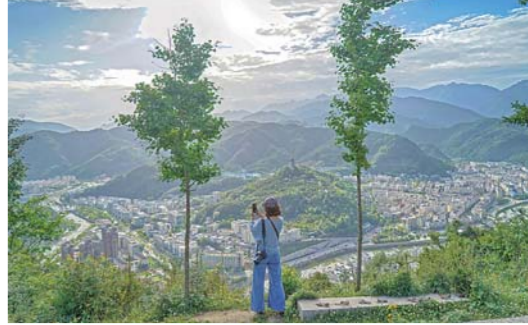
5月11日，一名女士在拍摄四川省青川县县城景色。经过十年重建与发展，汶川地震灾区的容貌发生了巨大变化。