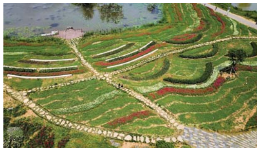
以农带旅 以旅兴农

近年来,江苏省南京市江宁区林陵街道观音殿村打造特色田园乡村,走上一条以农带旅、以旅兴农的绿色致富路。