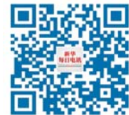
▲扫描二维码 观看微视频《传人》

200秒,穿越200年,感受马克思主义思想传播的大历史,感知马克思主义中国化的大成就,感悟新时代科学真理的大境界。中国共产党是《共产党宣言》精神的忠实传人!