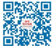
▲扫描二维码 观看微视频《初心》

从遥远的欧洲到神秘的东方古国,从《共产党宣言》到习近平新时代中国特色社会主义思想,马克思主义成为照亮人类前行的思想火炬。沧海桑田,初心未变。