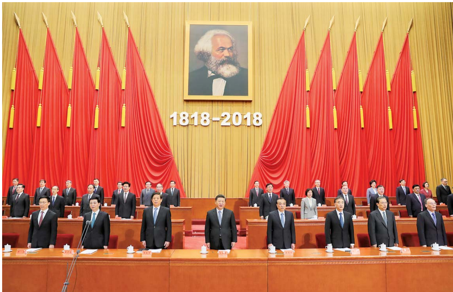
▲5月4日,纪念马克思诞辰200周年大会在北京人民大会堂隆重举行。习近平、李克强、栗战书、汪洋、王沪宁、赵乐际、韩正、王岐山等出席大会。

新华社北京5月4日电(记者张晓松、黄小希)纪念马克思诞辰200周年大会4日上午在北京人民大会堂隆重举行。中共中央总书记、国家主席、中央军委主席习近平在会上发表重要讲话强调,我们纪念马克思,是为了向人类历史上最伟大的思想家致敬,也是为了宣示我们对马克思主义科学真理的坚定信念。马克思主义始终是我们党和国家的指导思想,是我们认识世界、把握规律、追求真理、改造世界的强大思想武器。新时代,中国共产党人仍然要学习马克思,学习和实践马克思主义,高扬马克思主义伟大旗帜,不断从中汲取科学智慧和理论力量,更有定力、更有自信、更有智慧地坚持和发展新时代中国特色社会主义,让马克思、恩格斯设想的人类社会美好前景不断在中国大地上生动展现出来。