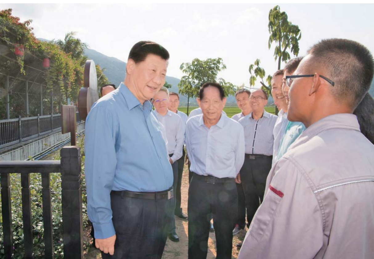
▲4月11日至13日，中共中央总书记、国家主席、中央军委主席习近平在海南考察。这是4月12日下午，习近平在国家南繁科研育种基地同袁隆平院士等农业科技人员亲切交谈，了解水稻育种制种产业发展和推广情况。