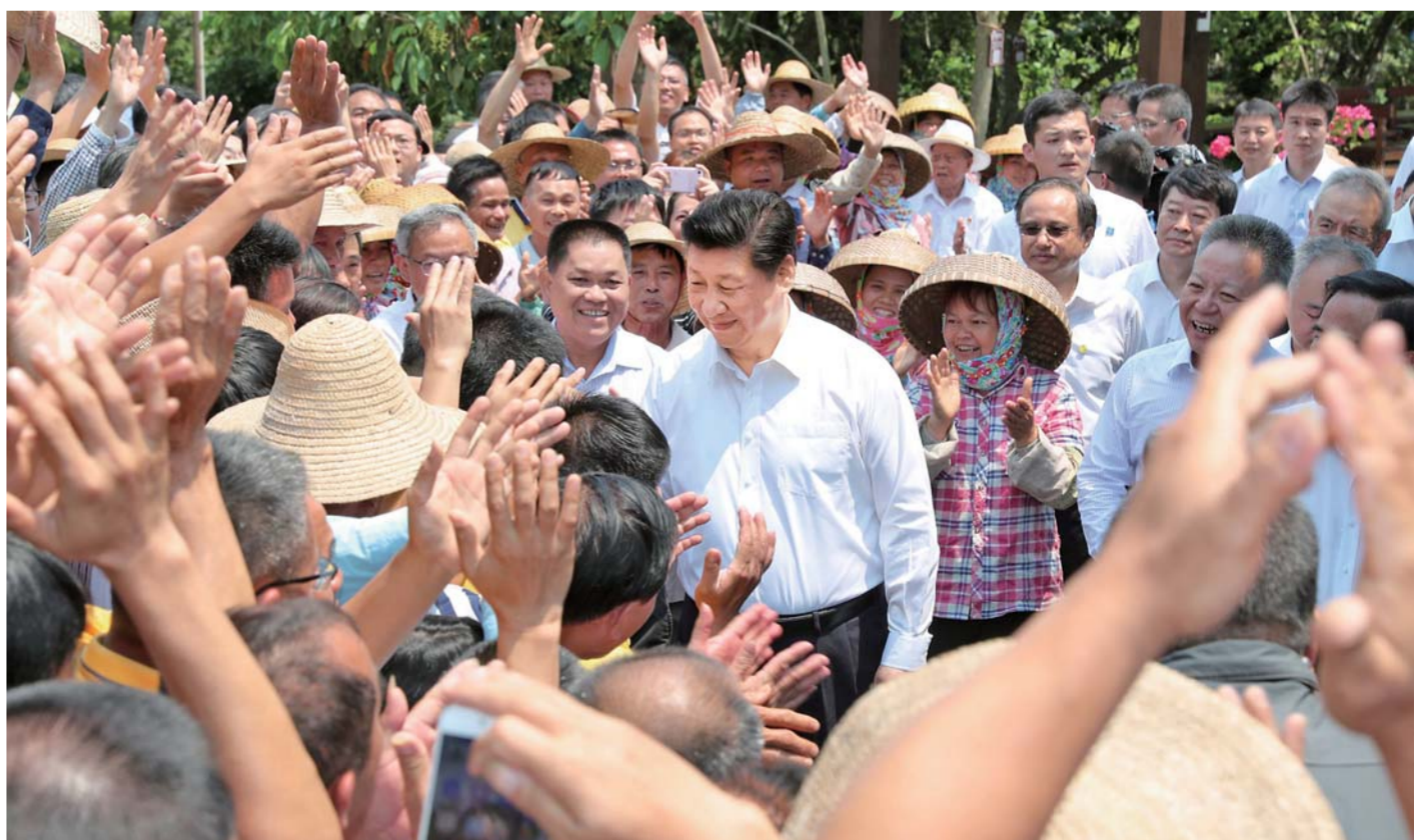
▲4月11日至13日，中共中央总书记、国家主席、中央军委主席习近平在海南考察。这是4月13日上午，习近平在海口市秀英区石山镇施茶村考察时，同闻讯前来的村民亲切握手。

新华社海口4月13日电中共中央总书记、国家主席、中央军委主席习近平近日在海南考察时强调，全面贯彻党的十九大和十九届二中、三中全会精神，统筹推进“五位一体”总体布局、协调推进“四个全面”战略布局，以更高的站位、更宽的视野、更大的力度谋划和推进改革开放，充分发挥生态环境、经济特区、