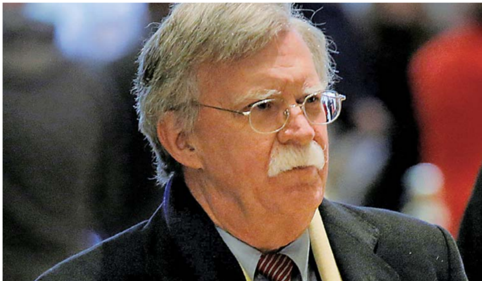
▲这是2016年12月2日在美国纽约拍摄的约翰·博尔顿的资料照片。

美国总统特朗普22日宣布，美国前常驻联合国代表约翰·博尔顿将取代麦克马斯特，出任总统国家安全事务助理，任命从4月9日起生效。博尔顿被美国媒体称为“战争鹰派”，他的上任将强化特朗普内阁的“鹰派”色彩。