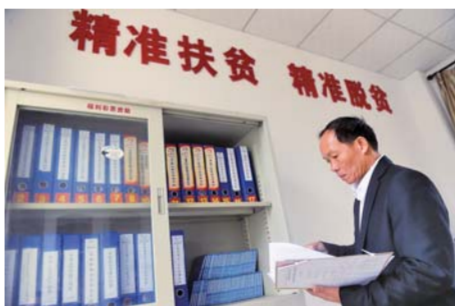
▲羊风极在打安镇田表村扶贫办公室查阅扶贫文件资料(1月10日摄)。