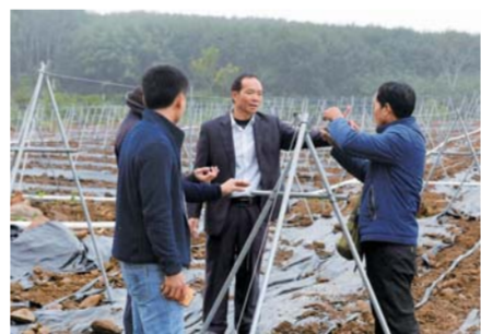
▲羊风极(右二)在打安镇田表村火龙果种植基地和农技员一起查看新建的农业设施(1月9日摄)。