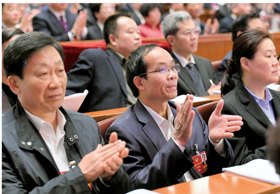
▲拼版照片:左图:羊风极(前中)在全国政协十三届一次会议第三次全体会议上听会(3月10日摄)。右图:羊风极在全国政协十三届一次会议第二次全体会议上作大会发言(3月8日摄)。