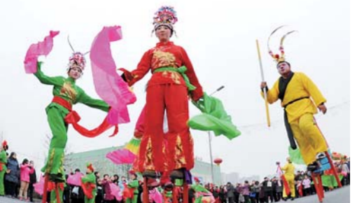
2月28日,在河北省任丘市举办的大鼓花会艺术节上,一支花会表演队在进行踩高跷表演。元宵节将至,河北各地举办传统花会活动喜迎佳节。