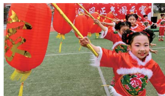
2月28日,福建省石竹中心小学学生在表演舞蹈。元宵节将至,福建省福清市广泛开展“移风易俗,清风正气”为主题的迎元宵佳节活动。