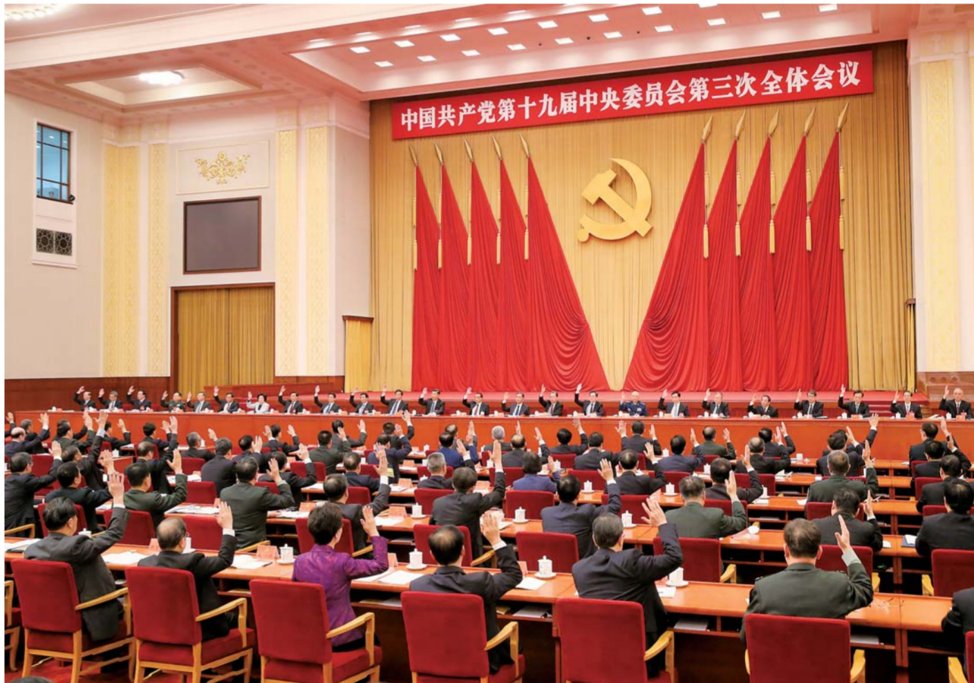
▲中国共产党第十九届中央委员会第三次全体会议,于2018年2月26日至28日在北京举行。中央政治局主持会议。