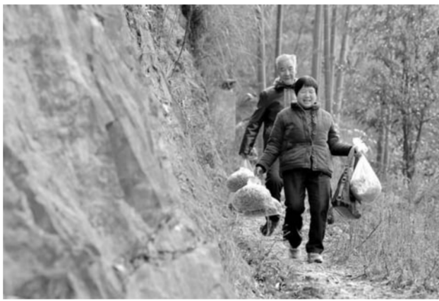
▲江西萍乡市湘东区广寒寨乡江山村村民拿着年货行走在山路上(2月8日摄)。