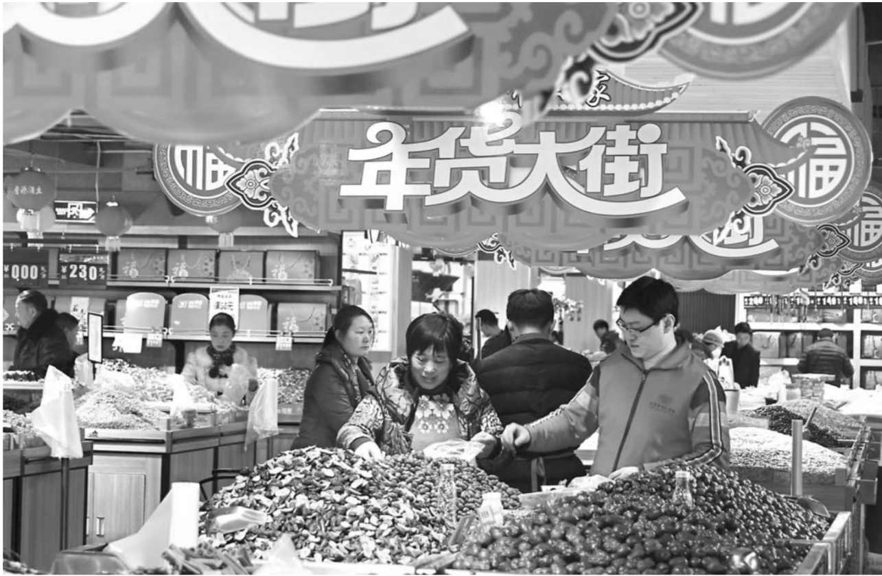
▲消费者在山东省沂源县一超市购买年货(2月12日摄)。

互联网也让一些民俗文化、农副产品闯进大市场，成为节日消费增长的主力。京东商城年货节上，对联、中国结、年货大礼包、福字、窗花等，成为排名前五的热搜词。