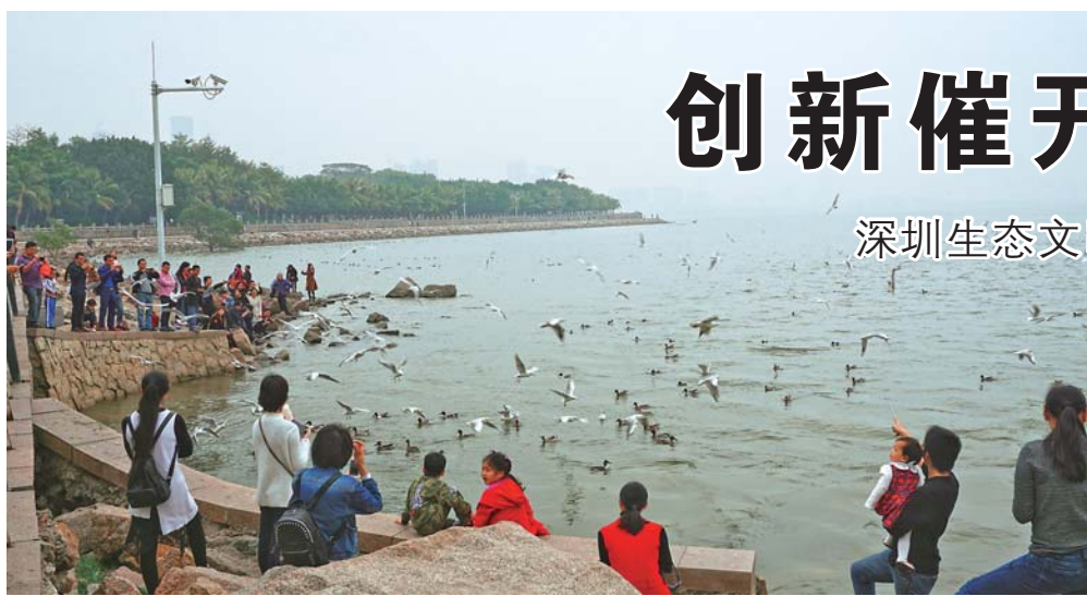
▲游人在深圳湾公园观鸟赏景(1月26日摄)。

而在重点保护区域,深圳以生态补偿弥补发展的不平衡。自2007年3月开始,位于东南部海岸的大鹏半岛获得了用于生态补偿的转移支付,并列出资助人员责任义务的明细。大鹏新区已累计发放补助资金17亿元,直接受惠村民1.6万人,当地群众看到了政府生态保护“久久为功”的决心。(下转6版)