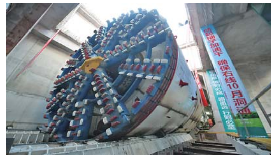
2月7日,直径8.8米的盾构“筑梦号”在北京轨道交通新机场线磁各庄站正式始发。至此,北京轨道交通新机场线所有大型盾构机全部实现进场。