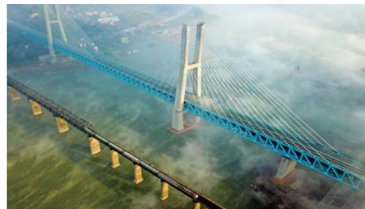
新白沙沱长江特大桥落成

经过5年艰苦建设，位于重庆江津的世界首座双层六线钢桁梁铁路斜拉桥——新白沙沱长江特大桥近日落成。