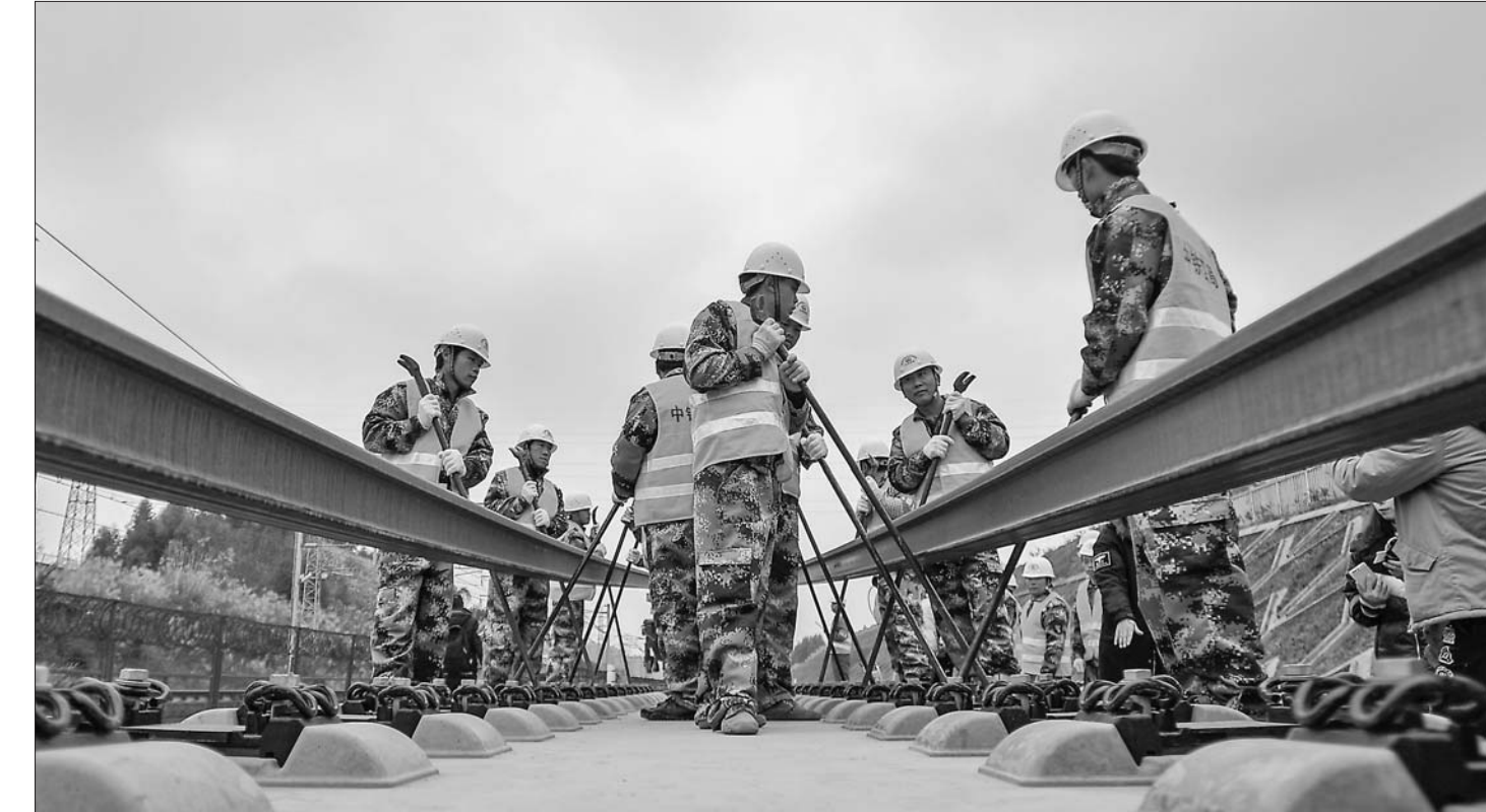
成贵高铁乐山至贵阳段进入铺轨施工阶段

试点工作鼓励通过政府专项资金扶持和数据应用竞赛等方式，支持社会力量利用开放数据开展创新创业，促进大数据产业发展。同时，将引导基础好、有实力的机构和个人利用开放数据开展应用示范，带动各类社会力量开展数据增值开发。