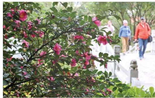
南国冬色亦暖人 时下正值冬季,在广西南宁金花茶公园,山茶花傲然绽放,为冬季增添一抹暖色。