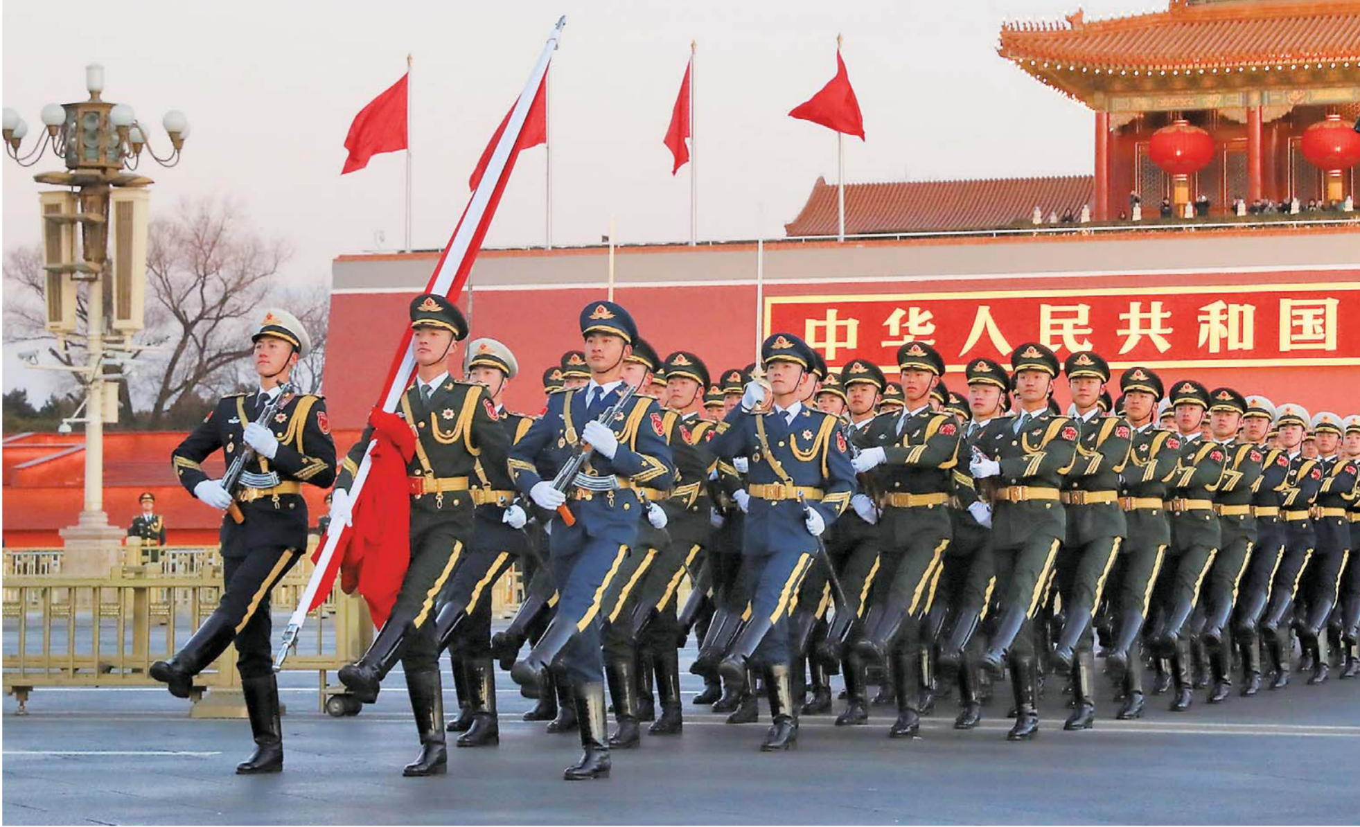
▲1月1日,北京天安门广场举行隆重的升旗仪式,这是由人民解放军担负国旗护卫任务后,首次举行的升旗仪式。

这一刻,各种各样的语调聚成一样的自信豪迈——“我们的生活天天向上,我们的前途万丈光芒”。“我们在实现中华民族伟大复兴的征程上阔步前进。”