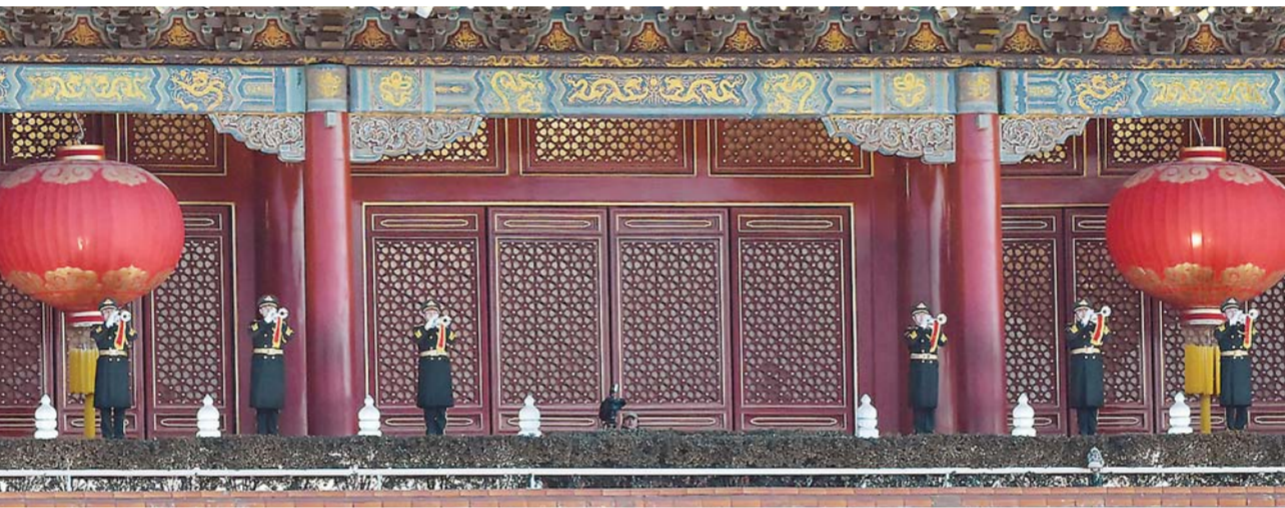
▲1月1日,礼号手在北京天安门城楼吹响升旗号角。