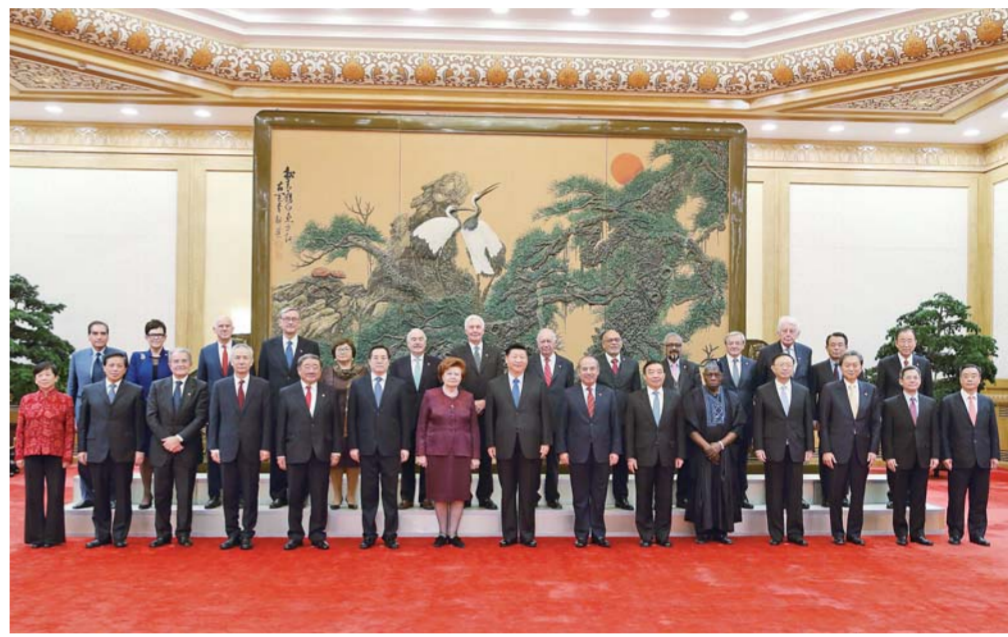
▲11月30日，国家主席习近平在北京人民大会堂会见出席“2017从都国际论坛”的世界领袖联盟成员。这是会见前，习近平同外方嘉宾集体合影。