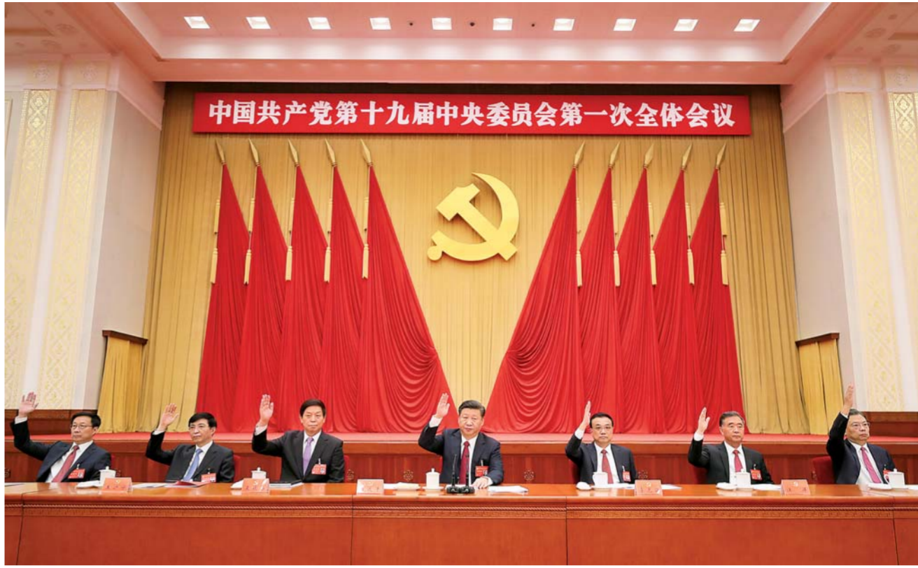
◀ 10月25日，中国共产党第十九届中央委员会第一次全体会议在北京人民大会堂举行。习近平同志主持会议并作重要讲话。