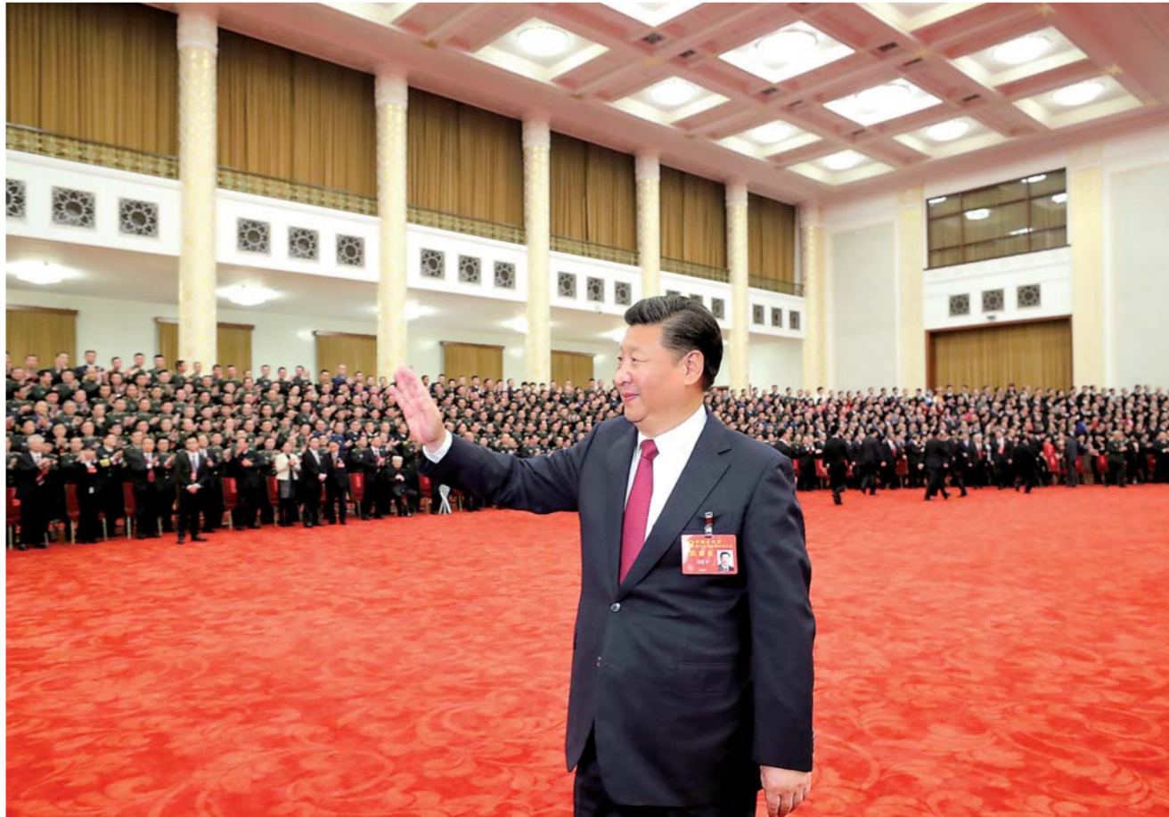
▶ 10月25日下午，中共中央总书记、国家主席、中央军委主席习近平等领导同志在北京人民大会堂亲切会见了出席党的十九大代表、特邀代表和列席人员。

参加会见的还有：全国人大常委会、国务院、最高人民法院、最高人民检察院、全国政协、中央军委领导同志和从领导职务上退下来的老同志。