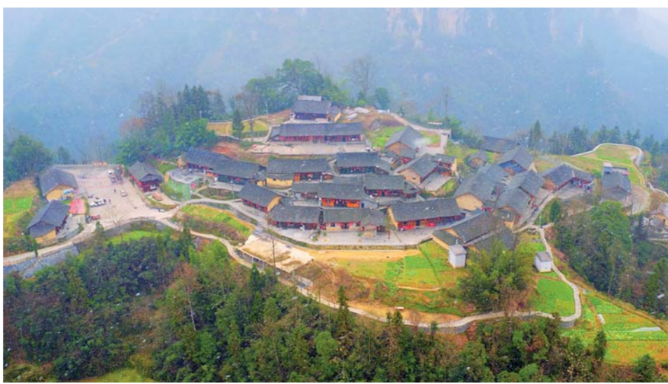
▲这是1月16日航拍的湖南湘西十八洞村。

在“两个阶段”中,第一个“奋斗十五年”历程,将从“创新型国家”“国家治理体系和治