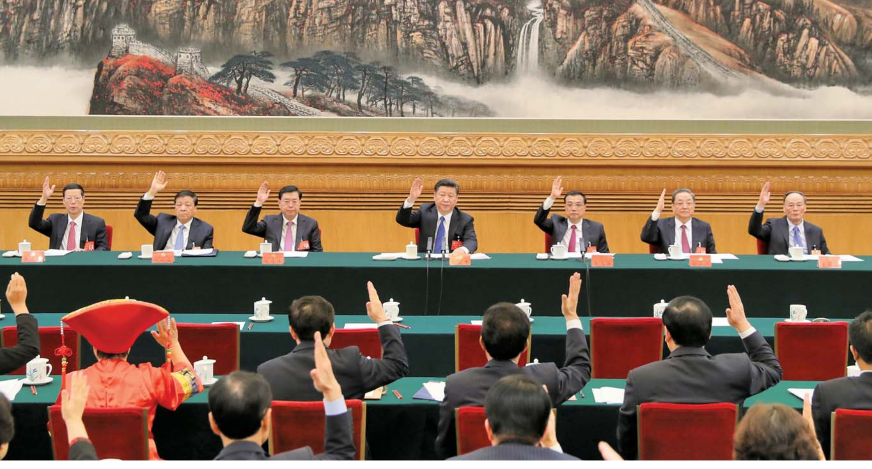
▲十月十七日,中国共产党第十九次全国代表大会主席团在北京人民大会堂举行第一次会议。习近平同志出席会议并作重要讲话。

新华社北京10月17日电中国共产党第十九次全国代表大会17日下午在人民大会堂举行预备会议。习近平同志主持会议。党的十九大应到代表、特邀代表2354人。出席预备会议的代表、特邀代表2307名。会议以举手表决方式,通过由22人组成的代表资格审查委员会名单,通过由243人组成的大会主席团名单,通过刘云山为大会秘书长。会议并通过了大会秘书处机构设置和工作任务。会议还通过了十九大的议程。大会的议程为:听取和审查十八届中央委员会的报告;审查十八届中央纪律检查委员会的工作报告;审议通过《中国共产党章程(修正案)》;选举十九届中央委员会;选举十九届中央纪律检查委员会。