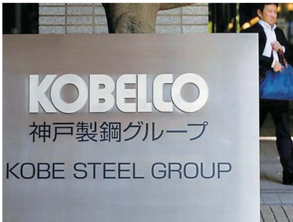
▲这是10月10日在日本东京的神户制钢所办公地点拍摄的企业标志牌。