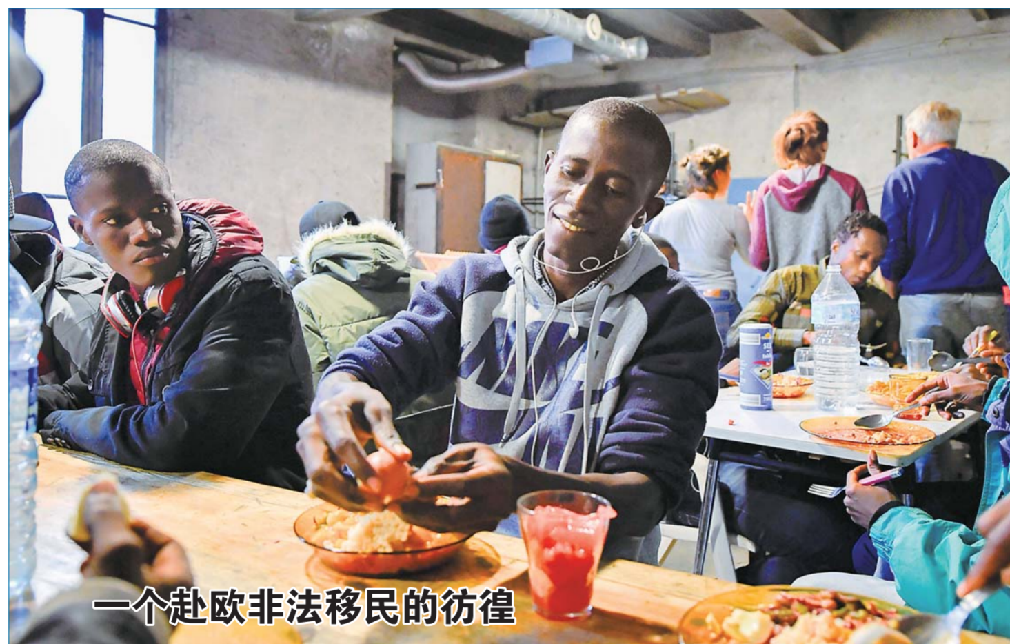
一个赴欧非法移民的彷徨

今年6月,伊拉克库尔德自治区宣布将于9月25日就库区独立问题进行公投,此举随即遭到伊拉克中央政府以及土耳其和伊朗等邻国强烈反对。美国、欧盟和联合国方面也表示支持伊拉克统一,希望库区和伊中央政府通过对话解决问题。