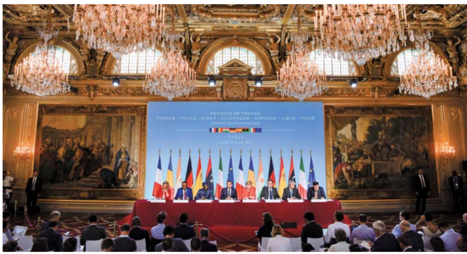
▲8月28日,在法国巴黎爱丽舍宫,(左至右)欧盟外交与安全政策高级代表莫盖里尼、尼日尔总统伊素福、乍得总统代比、法国总统马克龙、德国总理默克尔、西班牙总理拉霍伊、意大利总理真蒂洛尼和利比亚民族团结政府总理法伊兹·萨拉杰出席联合新闻发布会。