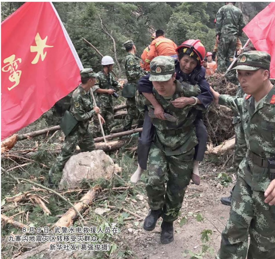
8月9日,武警水电救援人员在九寨沟地震灾区转移受灾群众。

灾情即刻牵动中南海——地震发生后,中共中央总书记、国家主席、中央军委主席习近平高度重视,立即作出重要指示,要求抓紧了解核实九寨沟7.0级地震灾情,迅速组织力量救灾,全力以赴抢救伤员,疏散安置好游客和受灾群众,最大限度减少人员伤亡。目前正值主汛期,又处旅游旺季,要进一步加强气象预警和地质监测,密切防范各类灾害,切实做好抗灾救灾工作,尽最大努力保障人民群众生命财产安全。