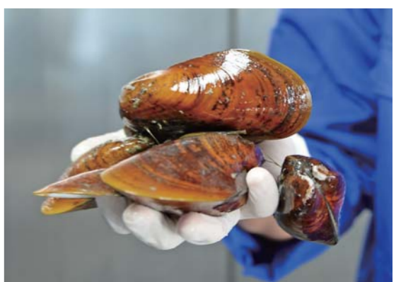
▲“发现”号采集到的贻贝(7月25日摄)。

7月25日，我国新一代远洋综合科考船“科学”号搭载的“发现”号遥控无人潜水器从南海一冷泉区带回大量生物样品，包括100多只潜蝇虾、贻贝和阿尔夫虾等生物样品，并拍摄了大量海底高清视频资料。