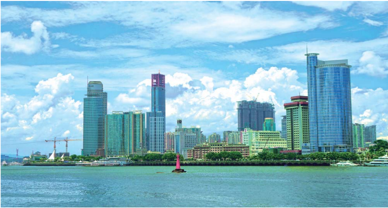
▲这是记者从往返鼓浪屿和厦门市区的轮渡上拍摄的厦门岛景色(7月3日摄)。