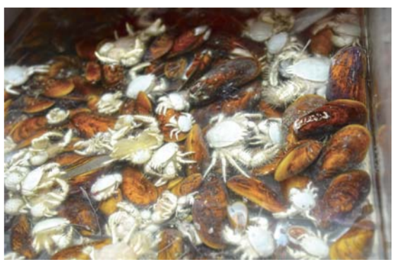
▲“发现”号采集到的大量生物样品(7月25日摄)。