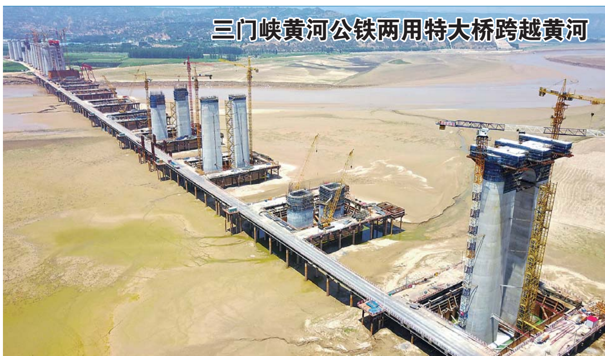
三门峡黄河公铁两用特大桥跨越黄河

约翰斯顿愉快地回忆了中国改革开放以来自己多次访华的经历，赞赏中国取得的发展成就。他表示，当前中加高层往来密切，合作不断取得积极成果，未来发展空间更加广阔。加方愿同中方共同努力，传承好加中友谊，在科技创新、教育、应对气候变化等领域加强合作，共同办好2018年中加旅游年。加拿大愿为中国成功举办2022年冬季奥运会提供支持。