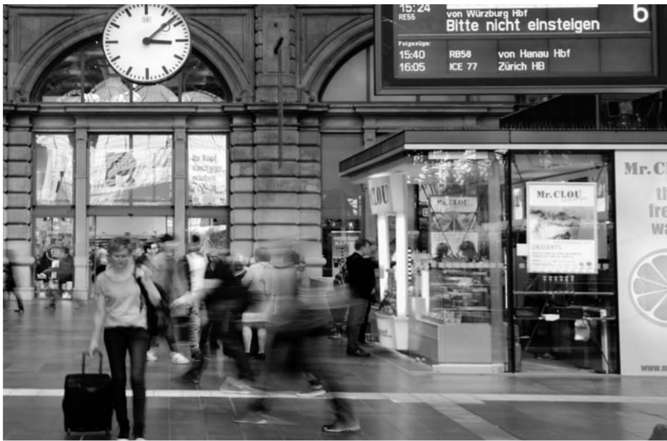
▲5月15日，在德国法兰克福火车站，乘客经过恢复正常的列车电子时刻表。此前，这里曾遭到网络病毒袭击。

美国高德纳咨询公司网络安全分析师阿维瓦·利坦说，美国政府确实“存在疏忽”。但他对此感到无奈，“我们无法阻止美国政府研发网络攻击武器”。