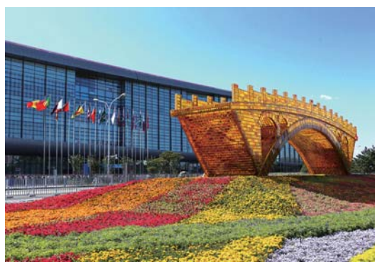
位于北京国家会议中心前的“丝路金桥”景观作品(5月13日摄)。