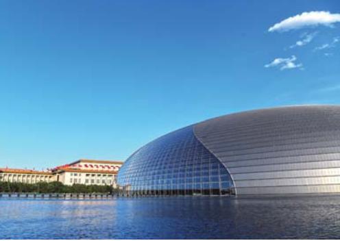
蓝天白云下的国家大剧院与人民大会堂(5月13日摄)。