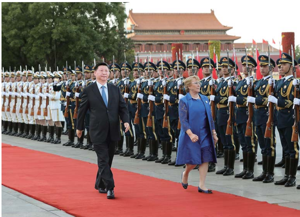
▲5月13日,国家主席习近平在北京人民大会堂同智利总统巴切莱特举行会谈。会谈前,习近平在人民大会堂东门外广场为巴切莱特举行欢迎仪式。