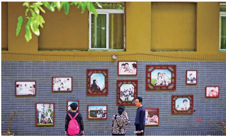
▲5月4日,居民在重庆渝中区上清寺街道嘉西村观看社区文化墙。

新华社重庆5月4日电(记者王丁、王金涛、陶冶)重庆,一座壮美的山水之城,一座日新月异的现代化都市。然而,与许多城市类似,被戏称为“繁华与破烂齐飞”的景象,却一度成为城市发展的“痛点”。当新城与旧貌的矛盾凸显之际,重庆开始了整治城市“死角”的民生攻坚。 近两年来,重庆主城区共整治402条背街小巷、306个老旧小区及107个农贸市场、48所学校、18所医院的周边环境,受惠群众近300万人。民调显示,这件民生实事增强了市民幸福感,群众满意度高达97%。